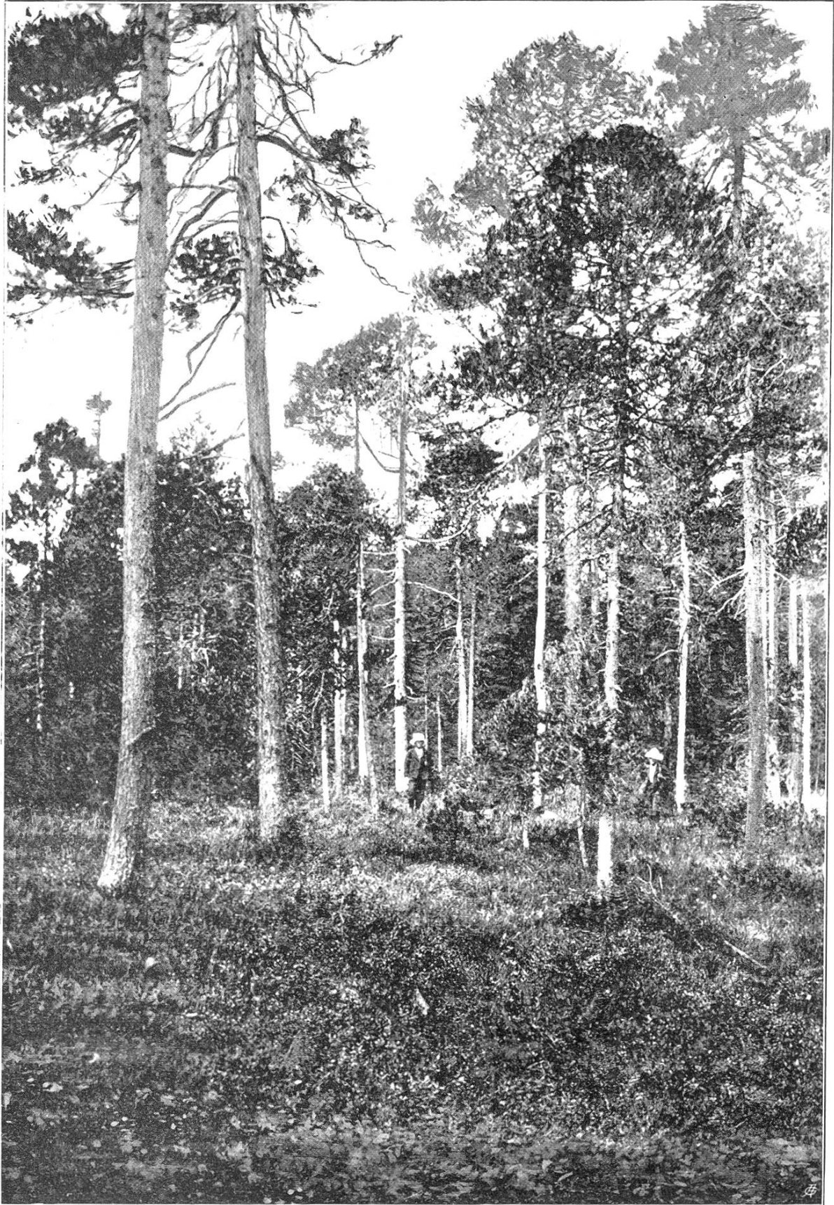
Moorkiefern-Bestand der Seigne de la Gruyère. (Gemeinde Saignelegier, bern. Jura.)