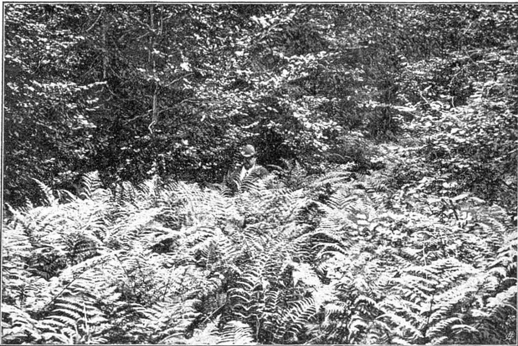
Farngruppe von Athyrium filix femina .

Unterhalb der Wylervorjäten fand sich in einem weiten Gefäude von Athyrium filix femina ein riesenhafter Stock eines Farn mit