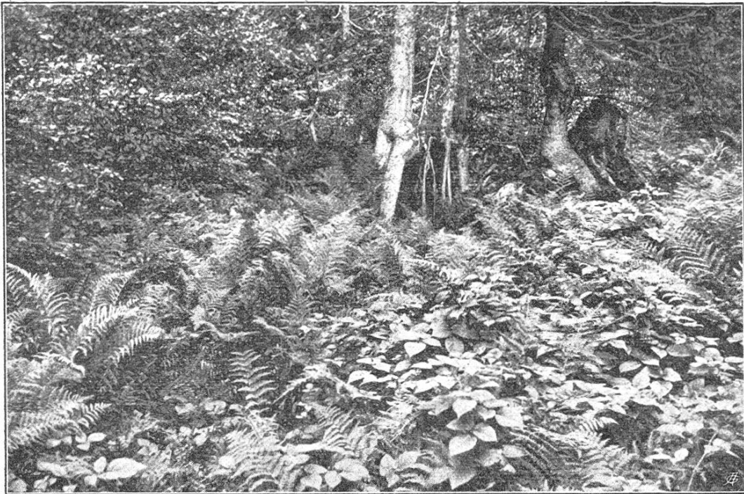
Farngruppe von Aspidium spinulosum .

Daran reihen sich die bekannten großen Formen des dilatatum mit dreifacher Teilung, und zwar vorherrschend nicht breit deltoid, son-