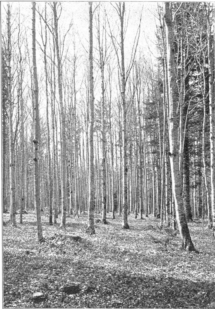
Stark durchforsteter Buchenbestand im Staatswald Béroie (bern. Jura).

stellten Baumkronen, sondern infolge der durch den lichten Schluß beschleunigten Zersetzung der Bodendecke auch ein günstiger Einfluß auf die Ernährung durch die Wurzeln bemerkbar. Durch das kühle Klima und die häufigen Niederschläge wird eine Abnahme der Bodenkraft allerdings verzögert, daß sie aber mit der Zeit eintreten werde, kann kaum einem Zweifel unterliegen.