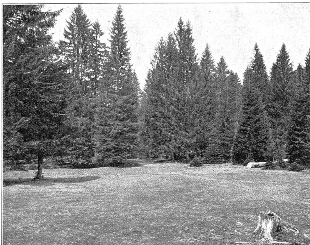
Wytweide mit gruppenweiser Bestockung.

Beide Arbeiten ernteten lebhaften Beifall. Die Diskussion wurde nur wenig benutzt und machte kaum neue Gesichtspunkte geltend, hingegen dürften die auf aufmerkamer Naturbeobachtung beruhenden, gründlich