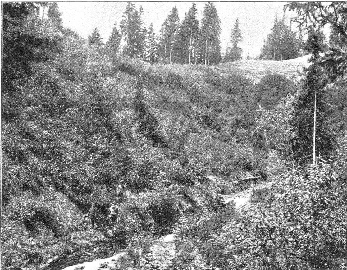
Fig. 3. Schmittenbach. Große Finsterbachplaike im Jahre 1894.

brochene Lehnen), welche früher bei jedem Hochwasser große Geschiebismengen abgaben. Im ganzen sind nicht weniger als 57,310 Qm. Flechtwerk erstellt worden. An der guten Wirkung dieses Hilfsmittels bei sachgemäßer Anwendung ist nicht zu zweifeln. Sie erhellt auch aus den beigegebenen drei Abbildungen (Fig. 1—3), welche die „Finsterbach-Plaike“ unmittelbar nach ihrer Verflechtung,