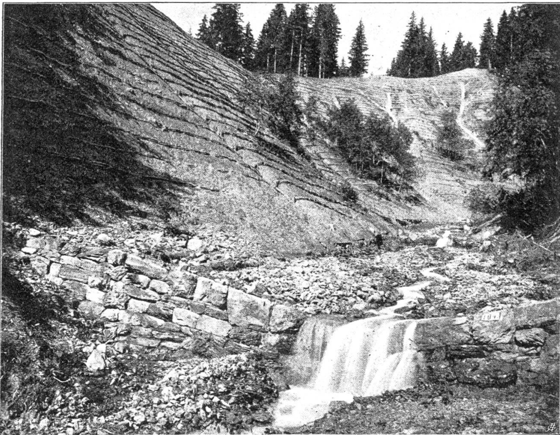
Fig. 1. Schmittbach. Große Finsterbachplatte im Jahr 1889.

kastenbau) sind, da meist genügend brauchbares Steinmaterial vorhanden, nur wenige (5 Stück) zur Ausführung gelangt. Zur Sicherung des Fußes der vielfach angebrochenen Grabeneinhänge dienten Längsbauten in Trockenmauerwerk (Streichmauern) von einer gesamten Länge von 434 Lfm. Diese ganze Bachverbauung hat sich bis dahin trefflich bewährt und man darf annehmen, daß sie in Verbindung