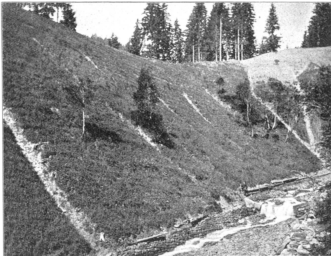
Fig. 2. Schmittenbach. Große Finsterbachplaike im Jahre 1892.

Terrain hinunterführen. Desterz finden sich solche offene Schalen mit den Sickerdohlen in der Weise kombiniert, daß die letztern, (vorzugsweise dort angelegt, wo bereits natürliche Rinnale vorkommen) bis fast zum Rand mit Steinen ausgefüllt und darüber an der Bodenoberfläche als flache Schalen gepflastert werden. (Vergl. Fig. 1 hinterer Teil der Rutschhalde). Wo, wie im vorliegenden Fall, nur