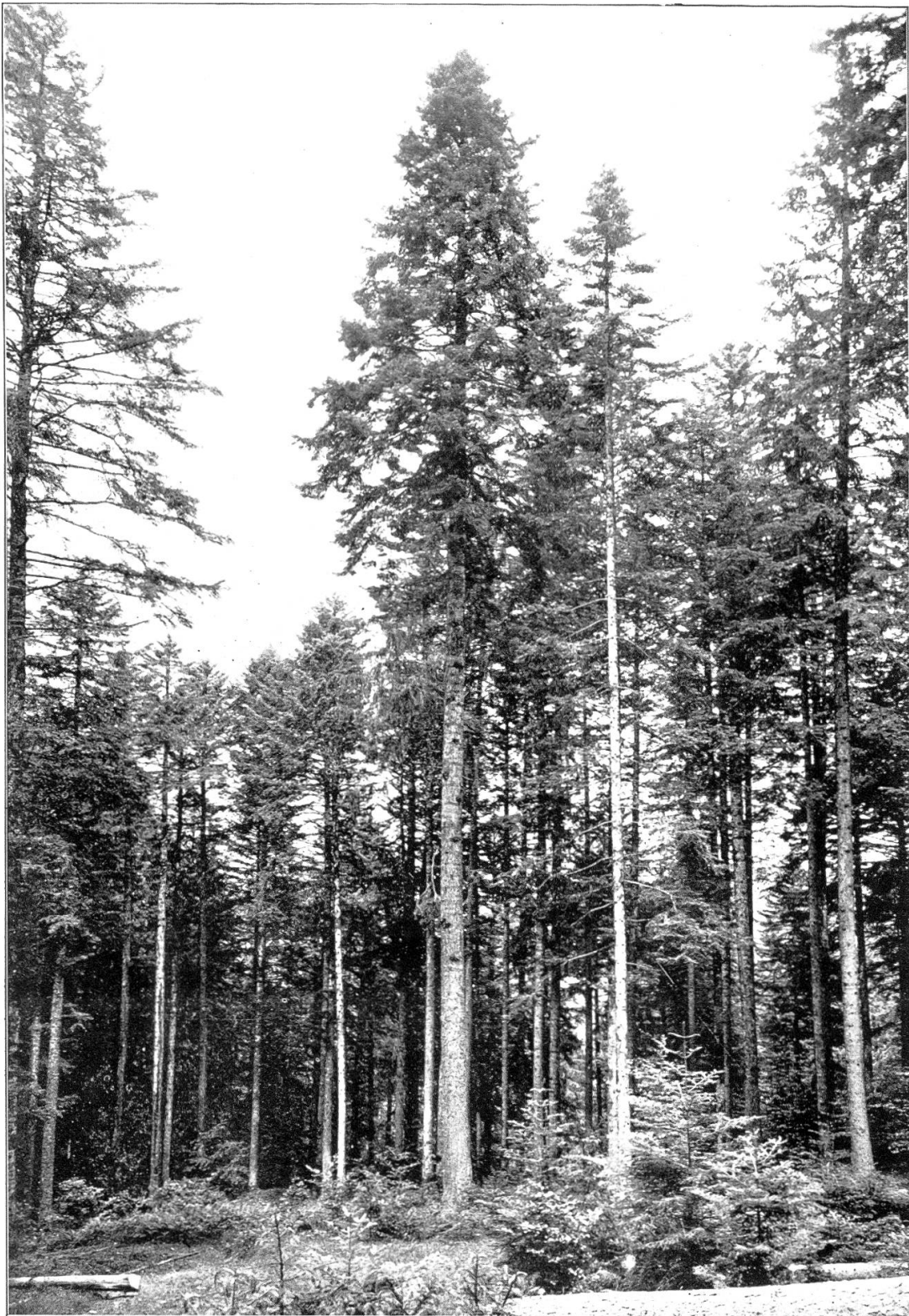
Weißtanne mit vollkommener Baumform im Großen Doppwald, 1070 m ü. M.; Länge 34 m, Durchmesser in Brusthöhe 72 cm.