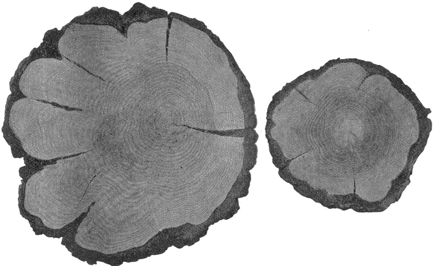
Fig. 1. Querschnitt der Stammbasis in 1,3 m über dem Boden, den ungleichen Zuwachs der beiden Individuen, sowie die Verwachsung der Hauptwurzeln beim Wurzelanlauf darstellend.

Wie bekannt, ist die immerwährende Entstehung neuer Zellen der Kambiumschicht zu verdanken, die durch den in der Baumrinde zirkulie-