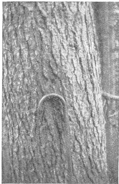
Typische Hagelholzrinde, Suldtal.