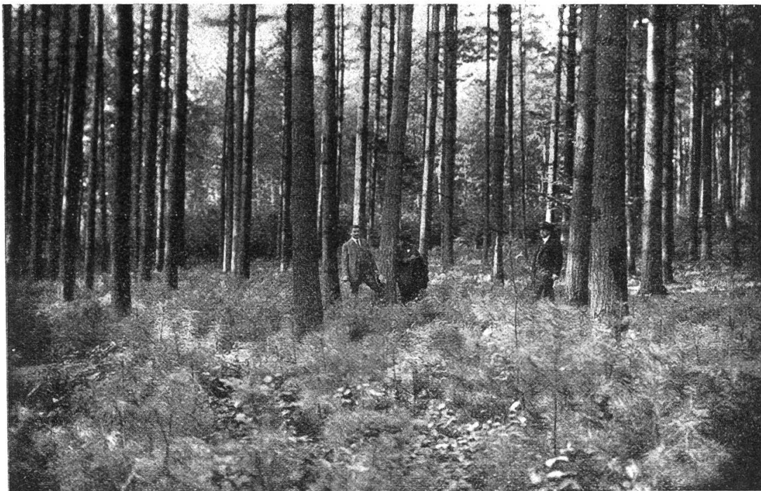
Abb. 1. Lenzburger Stadtwald Lütisbuch

Man begann erst, mit dem Anbau zurückzuhalten, als der Blasenrost ( Peridermium strobi Kleb.), der zuerst um das Jahr 1890 bemerkt wurde, sich immer stärker verbreitete und viele jüngere Bestände arg dezimierte. Die Krankheit hat ihre Gefährlichkeit bis heute nicht verloren, so daß zahlreiche Forstleute des In- und Auslandes zu der Ansicht neigen,