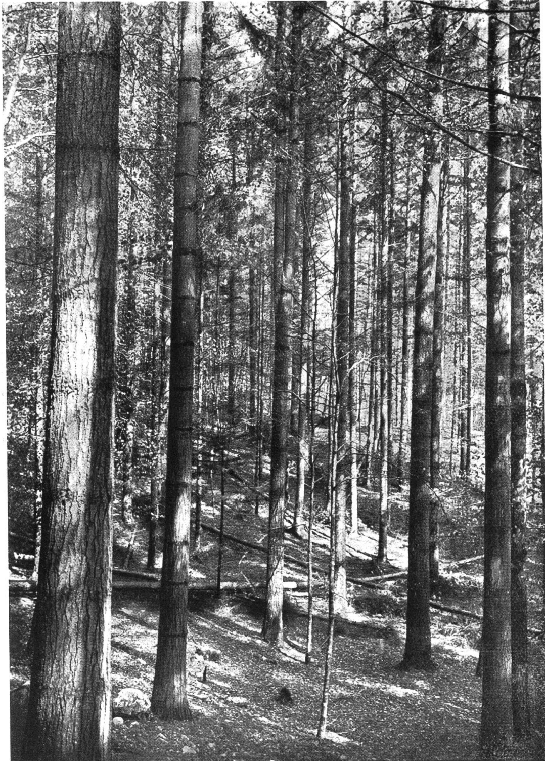
Tafel II. Versuchsfläche Erdmannlistein bei Wohlten (Aargau) Weymouthsföhre in Mischung mit Fichte, Föhre und verschiedenen Laubhölzern