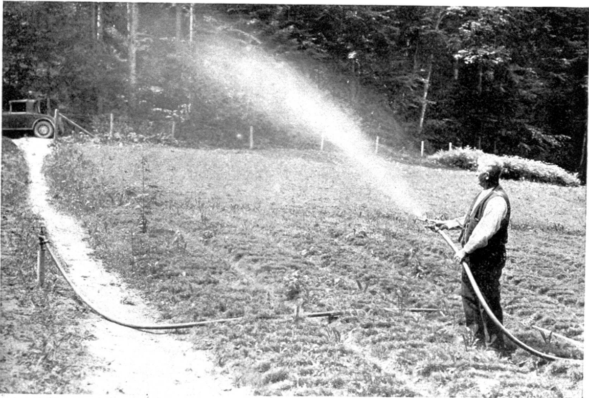
Abb. 4. Während der warmen Jahreszeit werden die Saaten aus einem 15 m 3 Wasser enthaltenden Reservoir besprüht.