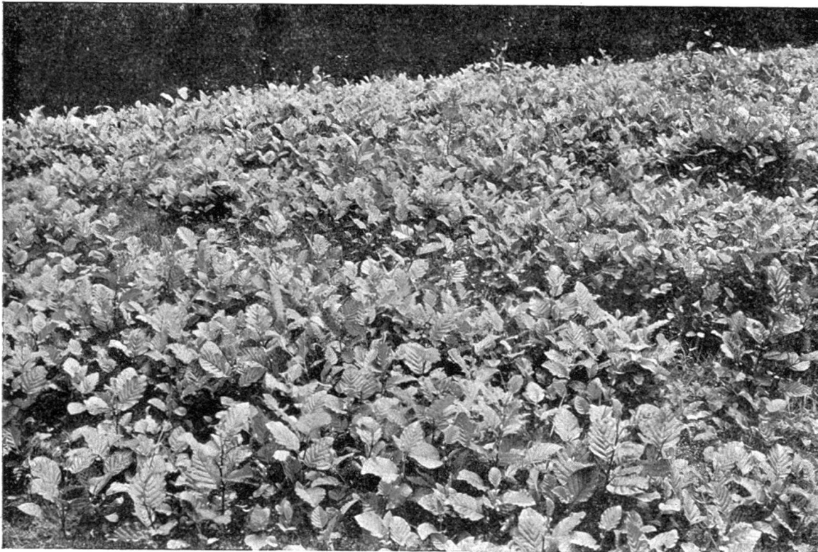
Abb. 6. Dichte Alpenerlensaat am Ende des zweiten Sommers. Die vielen unterdrückten Sämlinge sind nicht sichtbar.