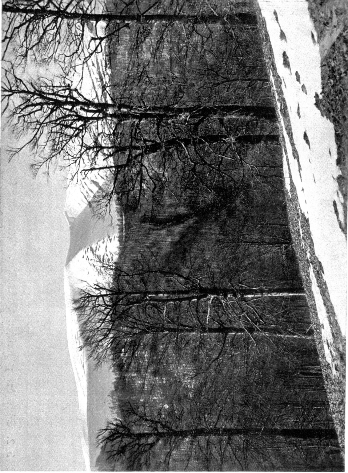
Abb. 1. Oberster Teil des Boršavatales. Buchenurwälder an der Waldgrenze, zirka 1300 m ü. M. Im Hintergrund der Sztoj, 1678 m ü. M.