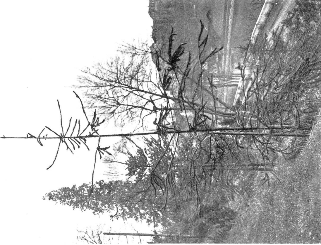
Fig. 2.