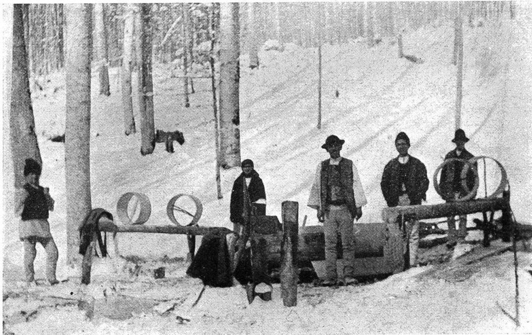
Werkstätte im Wald.

Banița ist ein Messgerät, das in Gebirgsgegenden den Doppeldekaliter ersetzt. Es dient sowohl als Mass als auch zur Aufbewahrung