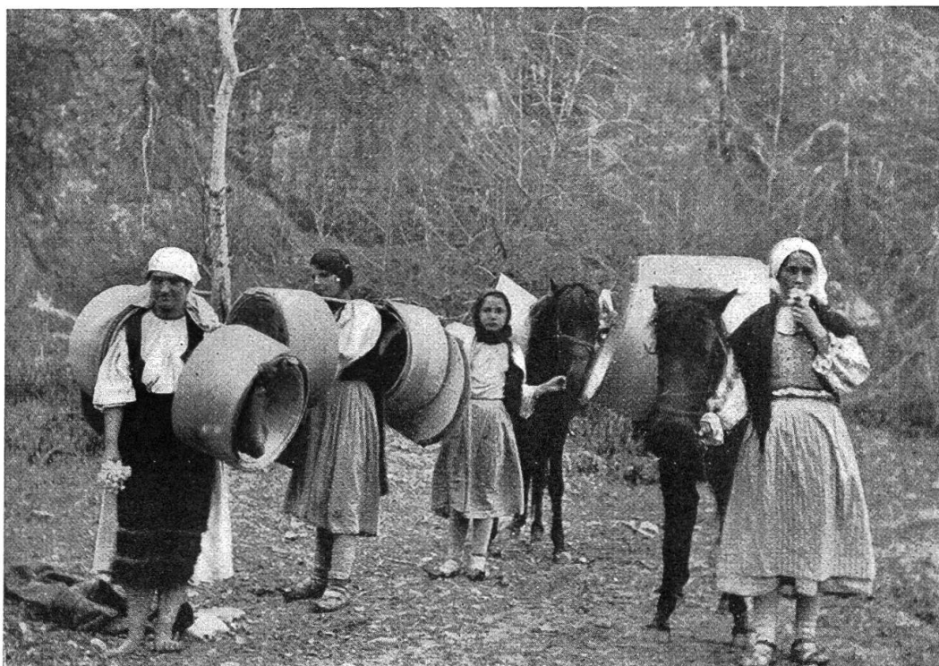
Beförderung der Reifen.

Eine Gruppe von drei Arbeitern kann täglich, ausser dem Fällen und Zuschneiden des Stammes, etwa 15—20 Reifen erstellen oder zu Hause 6—8 Banite bearbeiten.