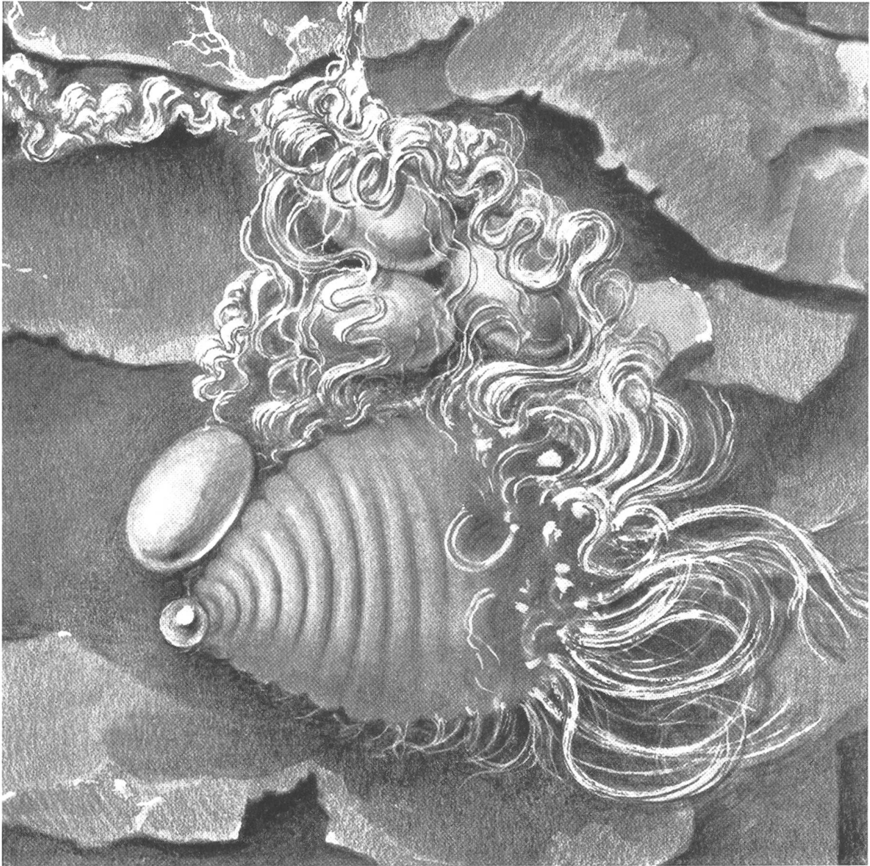
Bild 3. Ausgewachsene Fichtenstammmlaus mit starken Wachausscheidungen an Kopf und Brust, einem Exkrementtropfen am Hinterende und vier abgelegten Eiern; nach Ablösen der sie bedeckenden Rindenschuppe. Vergr. 110 X.