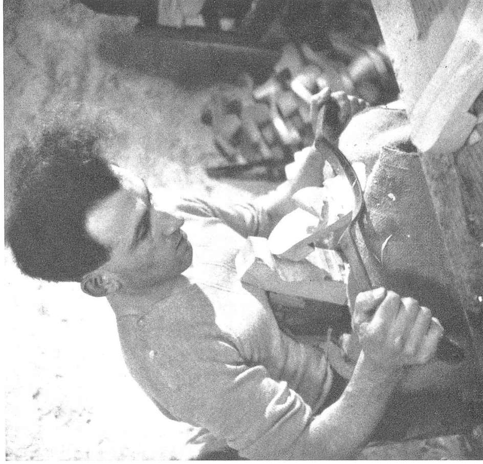
Mit Ziehmessern von verschiedener Form werden Sohle und Absatz säuberlich zurechtgeschnitten.