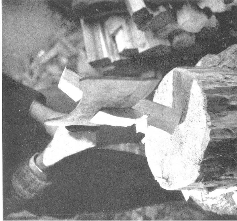
Zurichten der Scheiter.