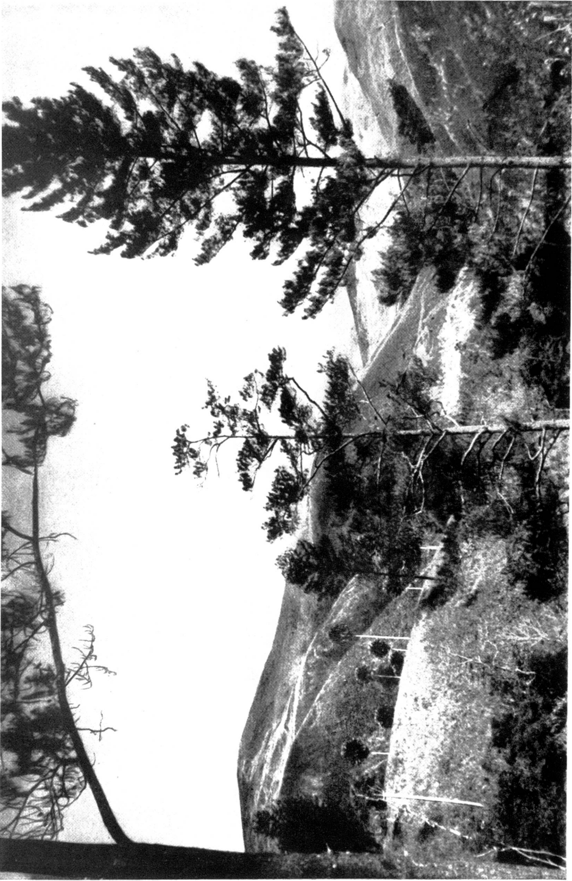
Abb. 2. Föhrenwäldchen ( Pinus mercusii ) auf Blang Broesa.