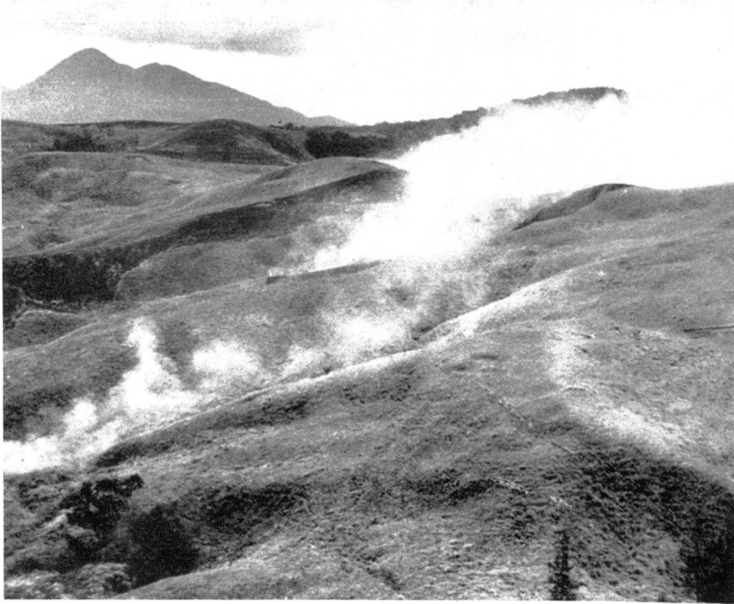
Abb. 3. Das brennende Blang Broesa.