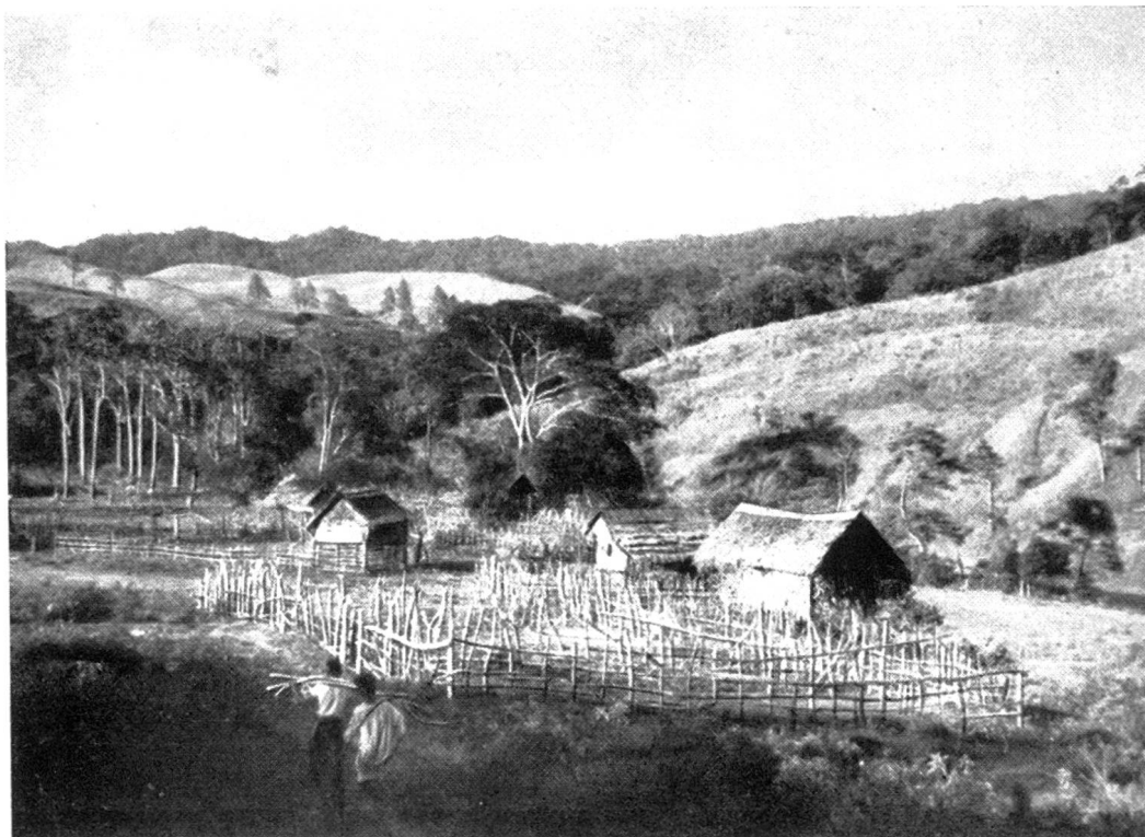
Abb. 4. Kampong Oesin auf Blang Broesa. Die Gärten müssen durch starke Umzäunungen vor Wildschweinen gesichert werden.