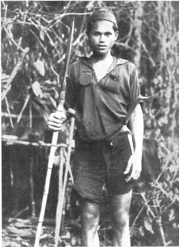
Abb 1. Teilnehmer einer Treibjagd am Peusangan.

Nach einer kurzen Wanderung erreichen wir den Peusanganfluß, wo wir direkt neben einer Gajo-Jagdhütte unser Zelt aufschlagen.