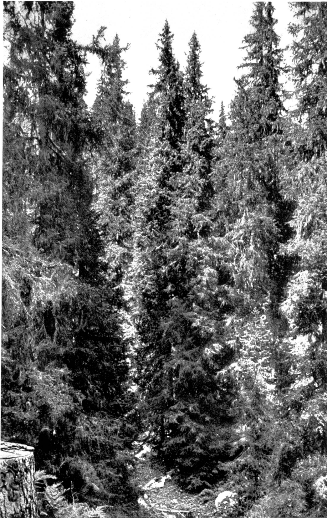
Plenterbestand der feinastigen Gebirgsfichte. Schwarzwaldalp an der Großen Scheidegg.