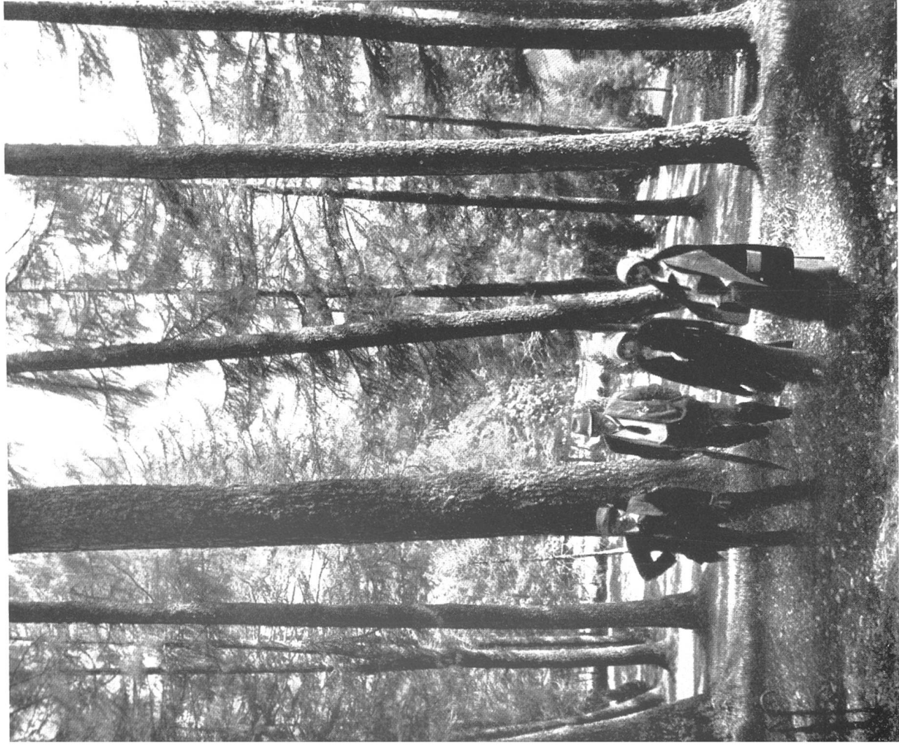
Die Kasthofer-Lärchen im Brüggwald bei Interlaken.