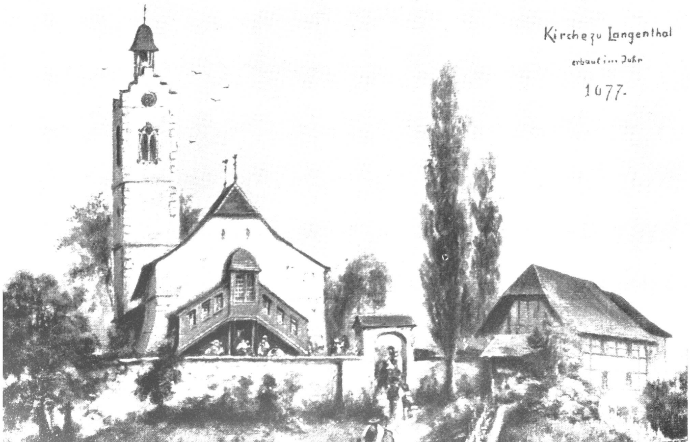
Kirche zu Langenthal