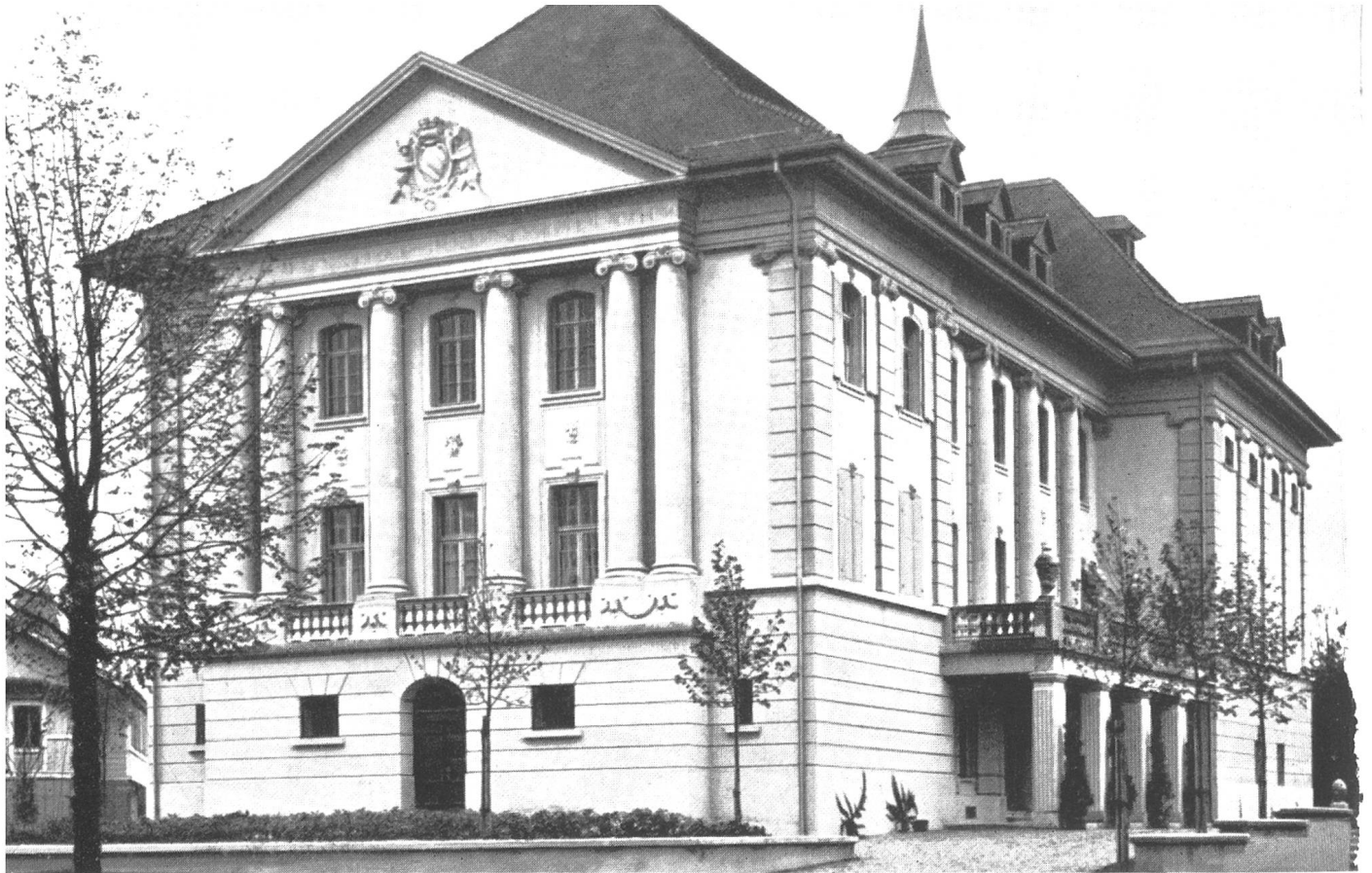
Theater (erbaut 1914—1916).