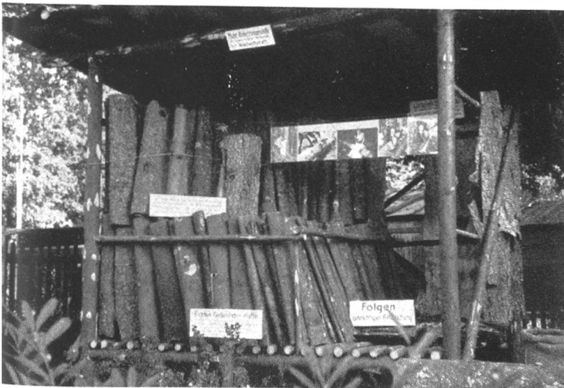
Das Innere der Rindenhütte, wie sie der schweiz. Verband für Waldwirt- schaft empfiehlt.