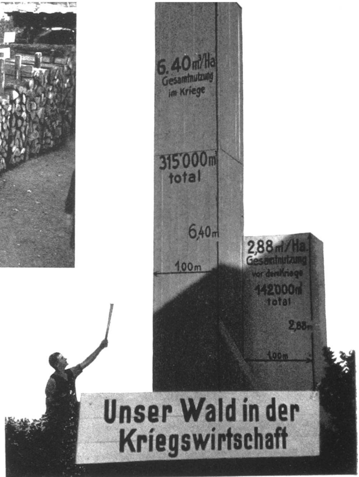
Holztürme von entsprechendem Raum- inhalt stellen die Gesamtnutzung je Hektar dar.