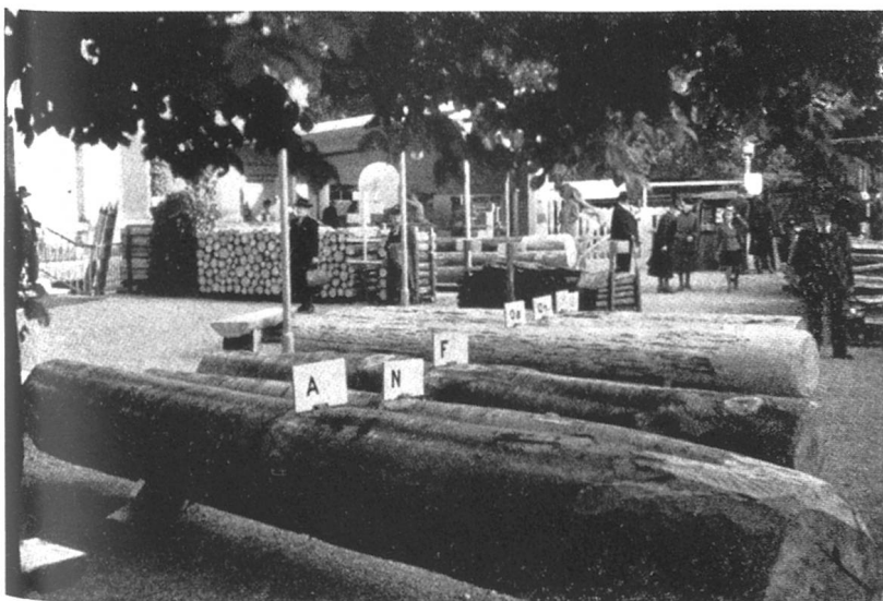
Laub- und Nadelholzsortierung nach Qualität.