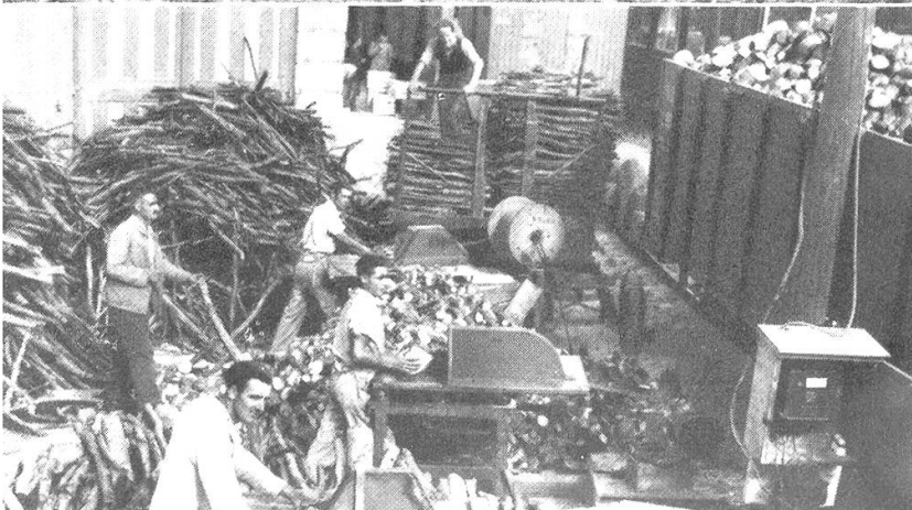
Hackholzaufarbeitung und Verlad Station St.Moritz. Das Holz stammt aus dem Bergell.