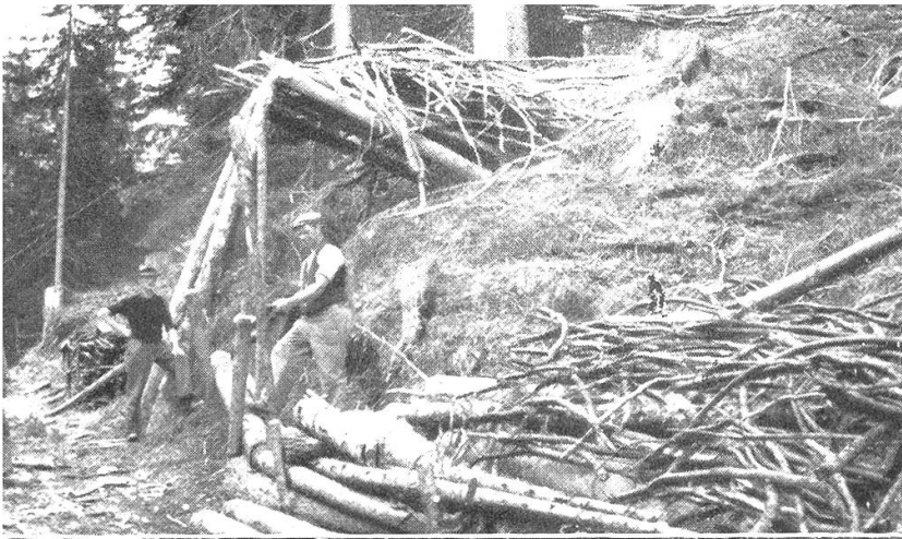
Astholz langt von oben in Büscheln über den Transportdraht am Waldwege an. Transportdistanz zirka 400 m.