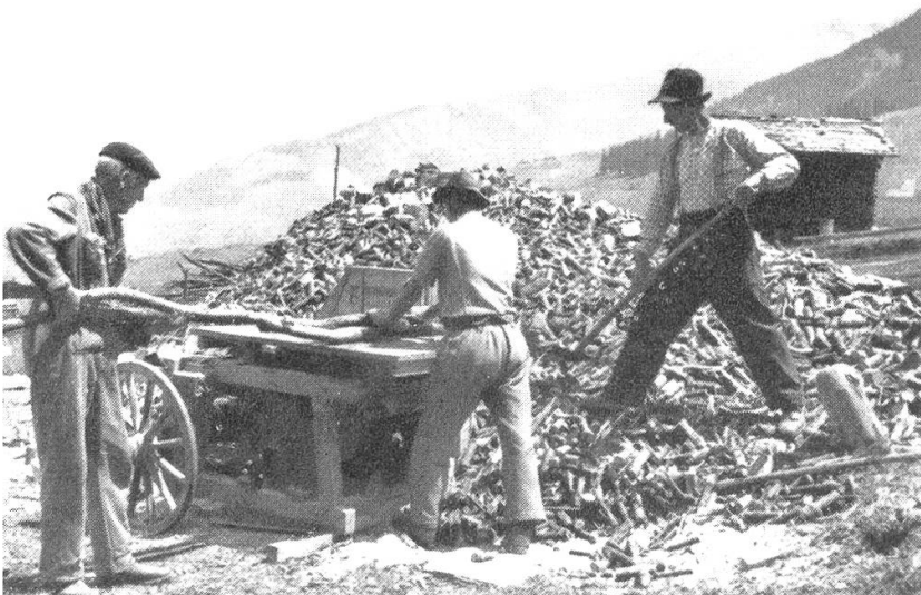
Aufarbeitung der Äste zu Hackholz beim Dorfe Camuns. Von hier aus Lastwagentransport.