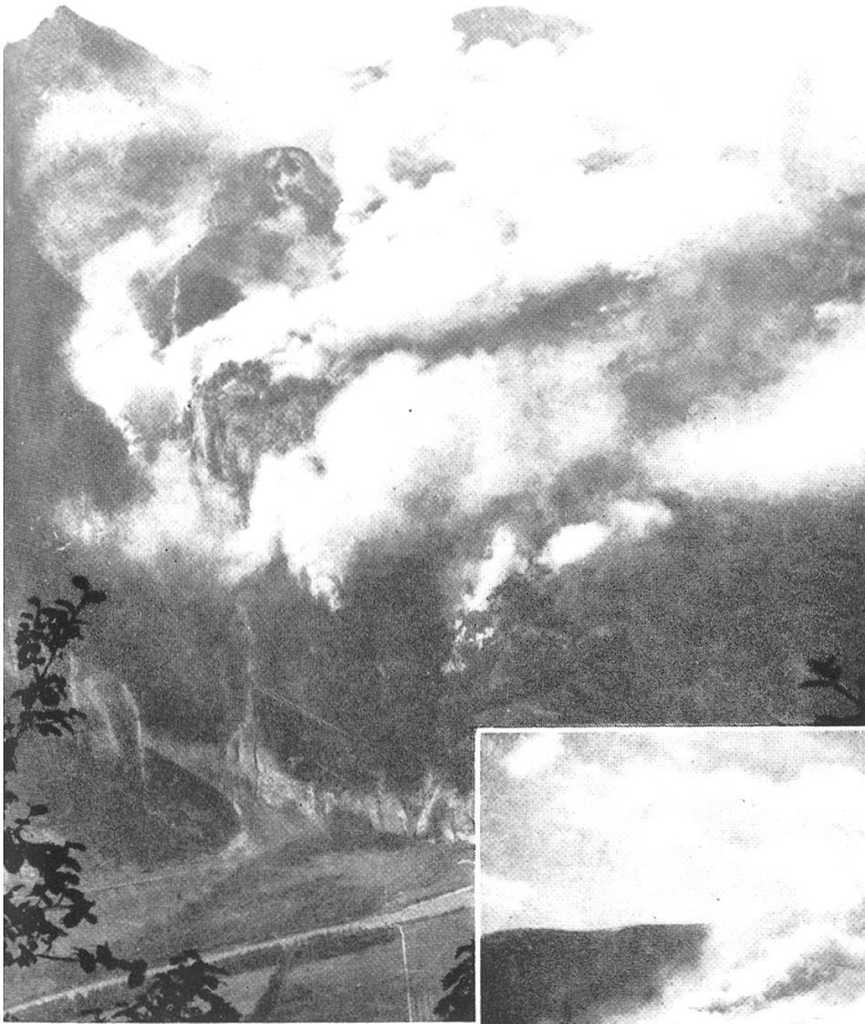
Entwicklung des Brandes am Nachmittage des 21. August 1943 in den westlichen Töbeln (Scheidtobel, Großtobel).