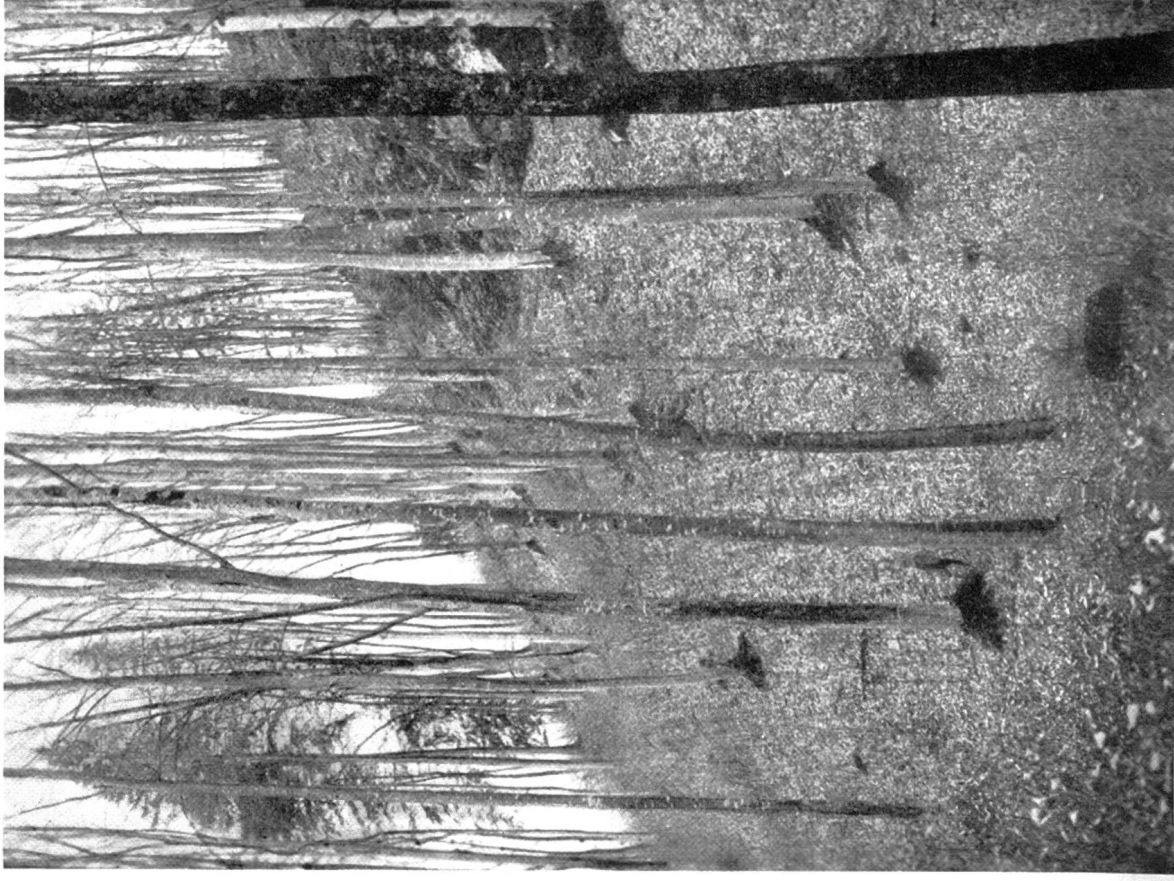
Photo: Oberförster Kaiser, Stans. Zahnwurzeicher Buchenwald am unteren Hangfuß, in Bachschluchten und Mulden. (Buche, beigemischt Bergahorn, Esche, Ulme. Sehr große Baumhöhen.)