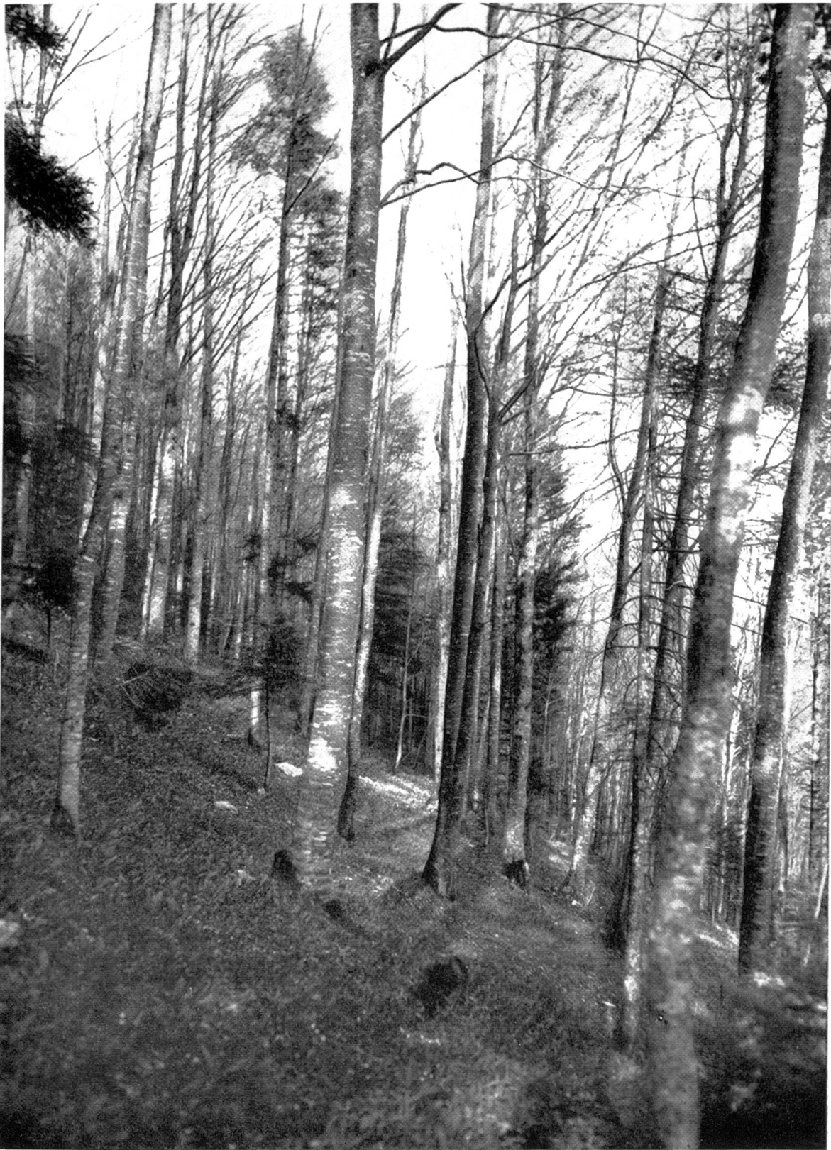
Reiner Buchenwald ( Fagetum typicum ), Jura-Südhang ( \pm 800–1200 m ü. M.)