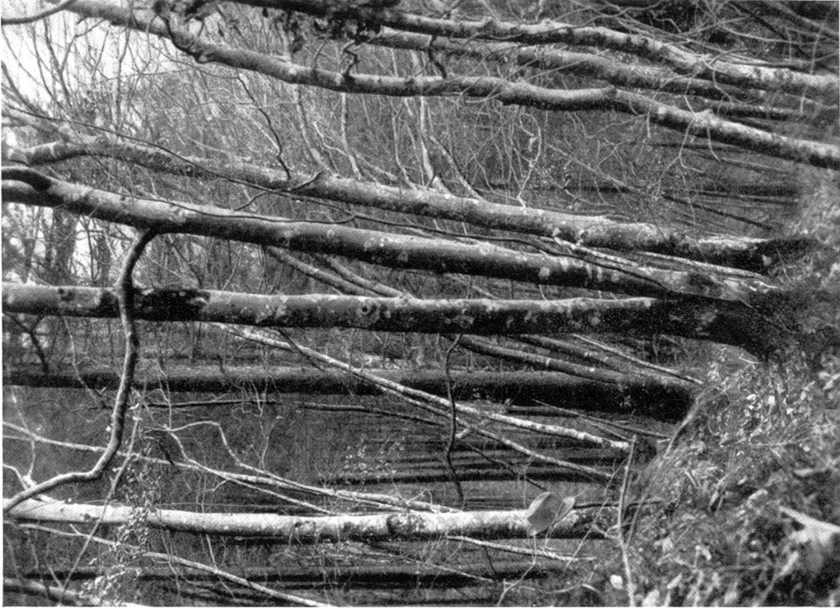
Heidelbeerreicher Buchenwald auf Kuppen. (Buche kurz und gedrungen.)