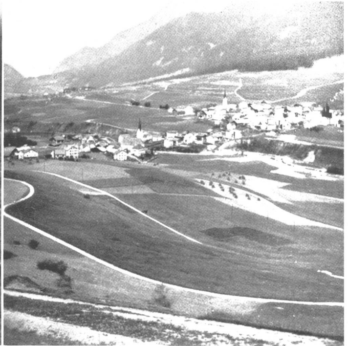
Links: Savognin: Kahlschlag zur Schaffung von Weide auf Bagianera. Die Baumstrünke sollen noch entfernt und der neu entstandene Waldsaum unterpflanzt werden. Massiver Holzzaun zum Schutze gegen Weidvieh am neuen Waldrand. — Rechts: Savognin. Im Vordergrund die 1941-43 im Zusammenhange mit der Güte zusammenlegung erstellten Flurwege.