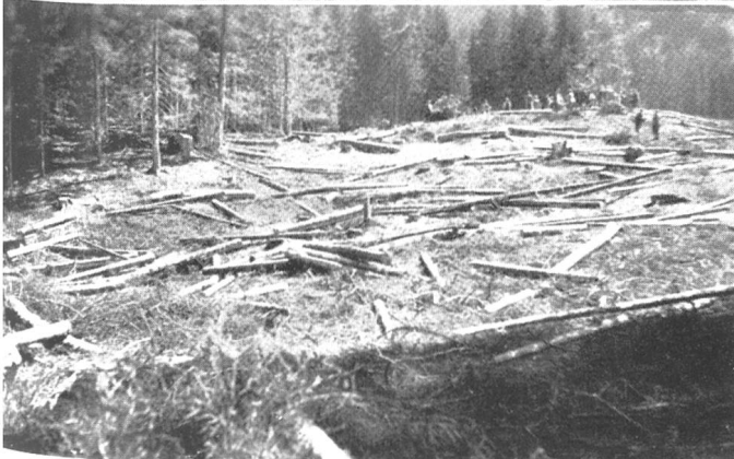
Lai bei Lenzerheide: Kahlschlag auf für Weide geeigneten Partien in den Waldungen der Gemeinde Obervaz.