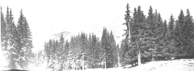
Obervaz-Lenzerheide: Bestehende Weidflächen werde vergrößert durch Entfernen einiger Baumgruppen und durch Zurückdrängen des Waldrandes. Die Weide gewinnt nicht nur an Fläche, sondern auch infolge geringerer