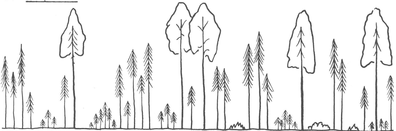
Wirtschaftsplenterwald im Nachhaltsgefüge