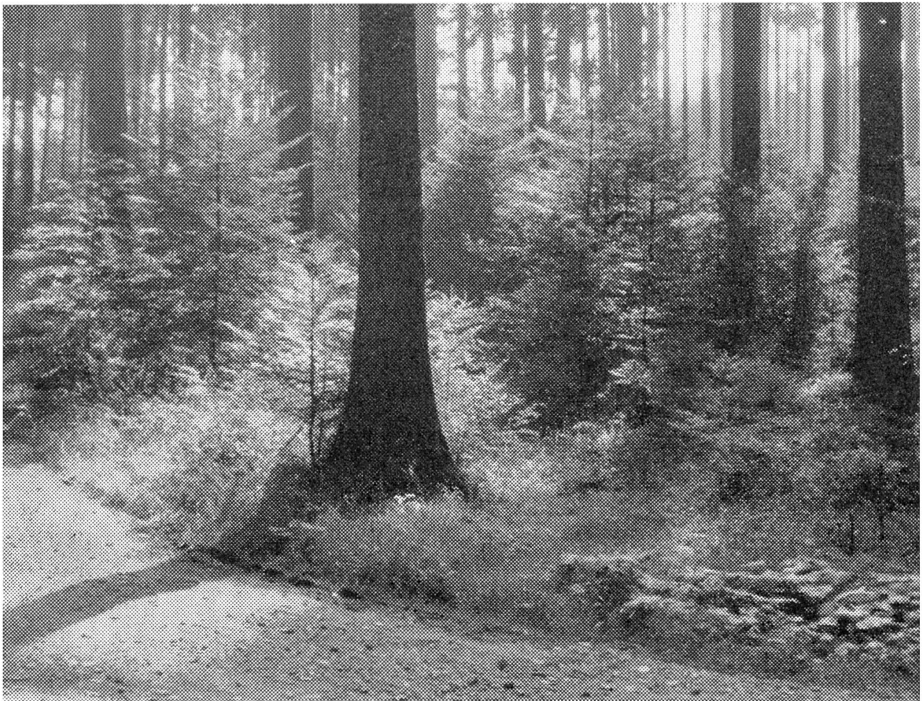
Femelschlagbild in einem Rottannen-/Weißtannen-Bestand. Heute fehlt jede Spur des früher arg zerstückelten Privatwaldes.

Bis zum Jahre 1924 belasteten große Ausgaben für den Bau der Korporationsstraße das Budget der Korporation. Nachher setzte die Wirtschaftskrise mit den niedrigen Holzpreisen ein. Erst seit 1935 stiegen die Holzpreise und damit die Reinerträge. Bei der Beurteilung der Reinerträge ist auch zu berücksichtigen, daß der Holzvorrat von 16685 m 3 im Jahre 1925 auf 28729 m 3 im Jahre 1955 angestiegen ist. Zudem weist der heutige Holzvorrat 9065 m 3 mehr Starkholz (Material über 36 cm Durchmesser in