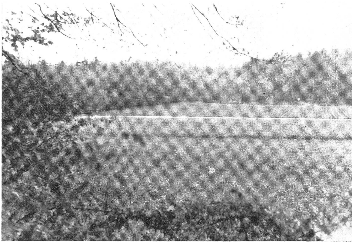
Windschutzstreifen zwischen Kestenbergr (links) und Staatswald Birrhard — leider mit Unterbrechungen durch Strassen, Bahnlinie und Kraftleitungen.