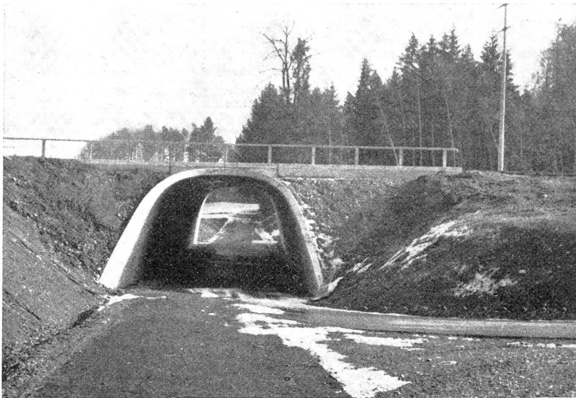
Wildunterführung zwischen zwei Waldkomplexen, Nationalstrasse Zürich—Bern; zugleich Wald- und Feldweg.