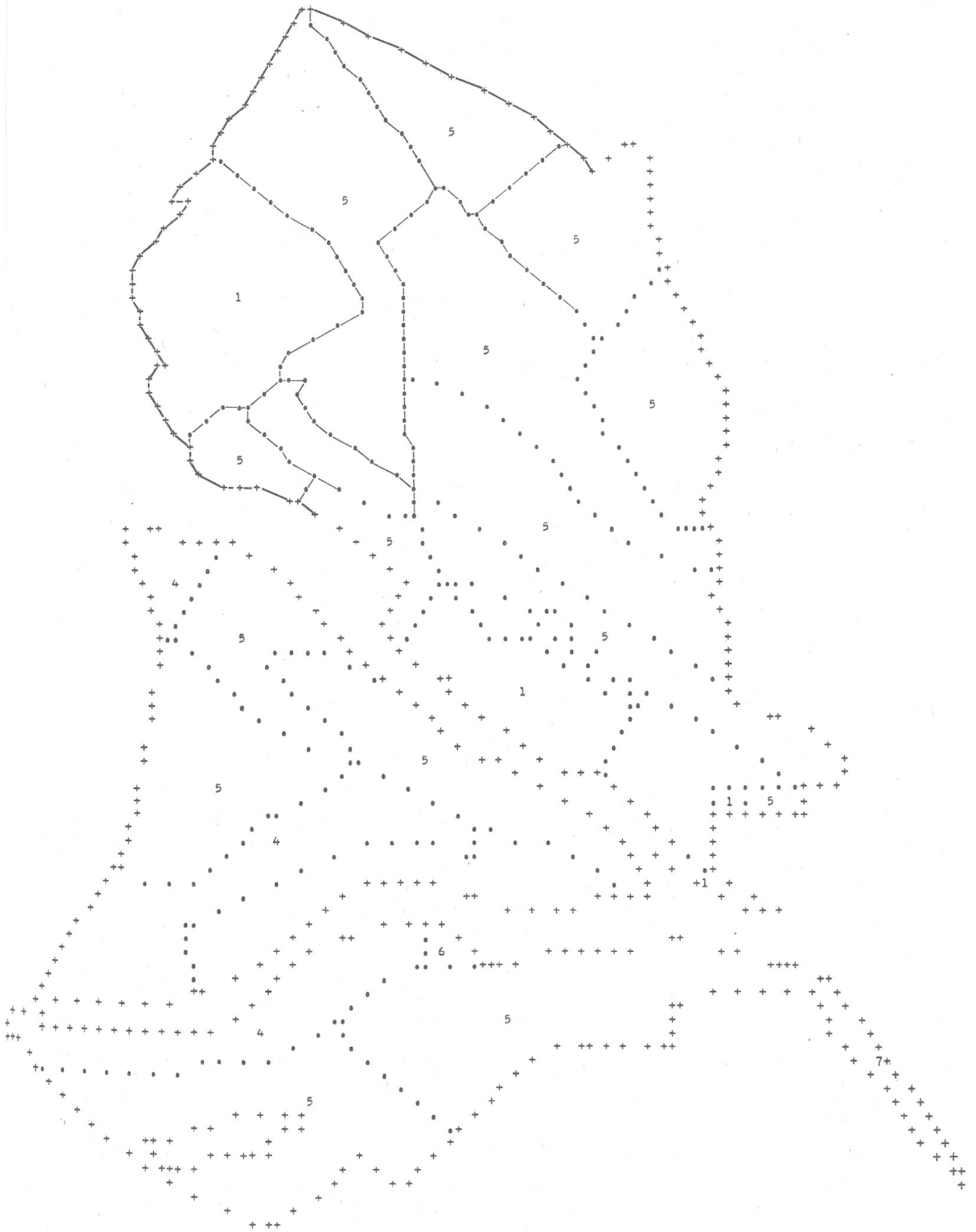
Figure 2. Représentation cartographique des essences d'une forêt donnée Partie supérieure de la figure: matérialisation plus précise de certaines limites de parcelles, par voie manuelle, à partir du listing de base