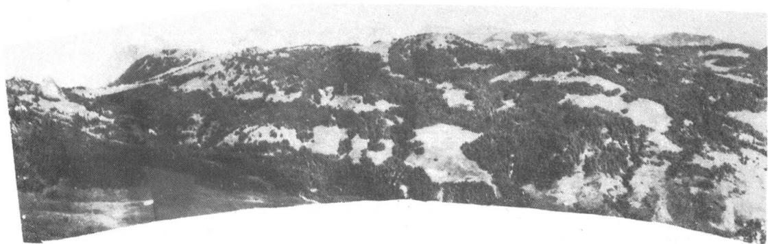
Photomontage 3. Leitidee «Erholung/Landschaft», Bewaldungsprozent 63 %.

3 Photomontagen zur bildlichen Darstellung von Alternativen (Ibergereggen und Furgelenstock).