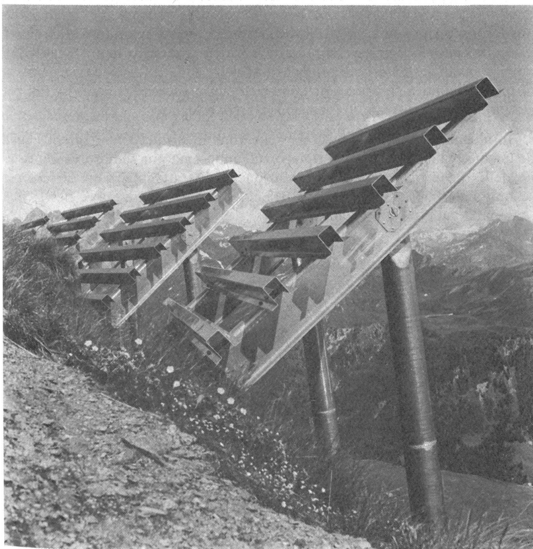
Figura 1. Pontes da neve in lamiera di alluminio sotto la Löita del Pizzo, alla Vallascia di Airolo. Lavori iniziati nel 1952

L'esercizio ferroviario, le vie di comunicazione e le linee di trasporto dell'energia elettrica subirono pure interruzioni e danni gravissimi: in particolare, verso le 0525 del 13 febbraio, pochi minuti dopo il passaggio di un treno-viaggiatori, la valanga del Pizzo Erra di Anzonico investì la ferrovia nella Biaschina, tra Lavorgo e Giornico, che rimase interrotta per ben otto giorni. Anche la strada cantonale sul fondo-valle e quella tra Anzonico e Cavagnago vennero ostruite e danneggiate.