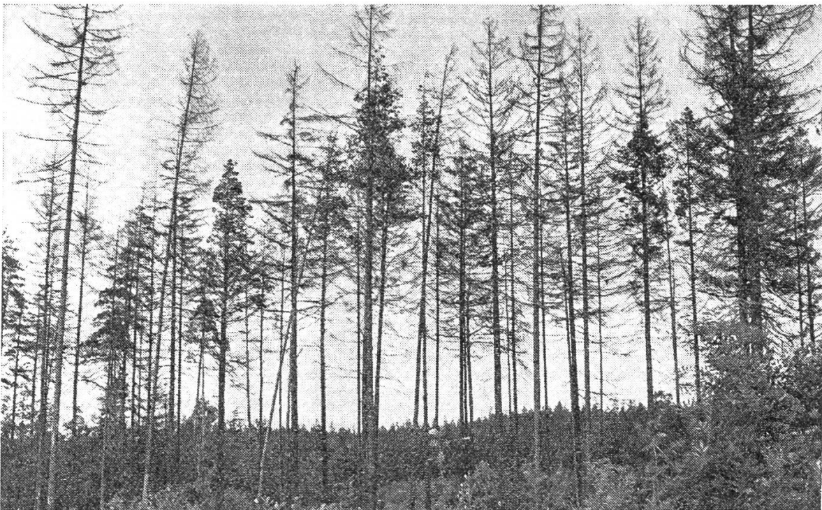
Abbildung 2. 60jähriger Fichtenbestand im Erzgebirge, absterbend, etwa 15 km von den Abgasquellen im böhmischen Braunkohlebecken bei Most entfernt. Immissionsbelastung nach Materna (1972): \bar{x} Jahr = 0,05 mg SO 2 .

Der Nadelwald ist im Empfindlichkeitsspektrum aller Lebewesen gegen SO 2 -Immissionen extrem empfindlich. Dies hat folgende sehr plausible Gründe, die ich beim letzten Hearing der deutschen Bundesregierung zur