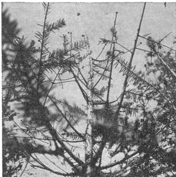
Durch den Hagelschlag entnadelte Fichten und Tannen im Küsenrainwald.