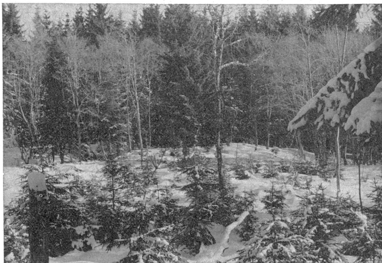
Bild 3. Beginnende Umwandlung reiner Weisslerlenbestände durch Pflanzung von Fichte. Im Hintergrund knapp 50jähriger Fichtenbestand.

Das Hauptziel der Entwässerung, die Stabilisierung des Rutsches durch die Ableitung des Wassers aus den Quellhorizonten, wurde sicherlich und zudem rasch erreicht. Um neue Rutschungen nach Möglichkeit zu verhindern und dem Wald bestmögliche Wachstumsbedingungen zu sichern, sind heute die bestehenden Entwässerungsanlagen zu unterhalten und teilweise beträchtlich zu erweitern. Der direkten Ableitung von Oberflächen- oder Quellwasser kommt dabei eine viel grössere Bedeutung zu, als einer eigentlichen Entwässerung des schweren Bodens. Die alten, im Zickzack oder quer zum Hang angelegten Hauptgräben haben sich nicht bewährt, weil die Erosion der talseitigen Grabenböschung zu grossen Schäden und oft zu einer eigentlichen Bewässerung führte. Hier müssen neue Gräben in der Falllinie angelegt werden, die allerdings schon bei recht kleinen Gefällen verbaut werden müssen. Die Erosion ist im Flysch sehr eindrücklich und besonders bei der Schneeschmelze und bei starken Gewittern ist die Auskolkung stark. Ein im Oktober 1978 neu erstellter Graben mit einem Gefälle von 10—15 % war