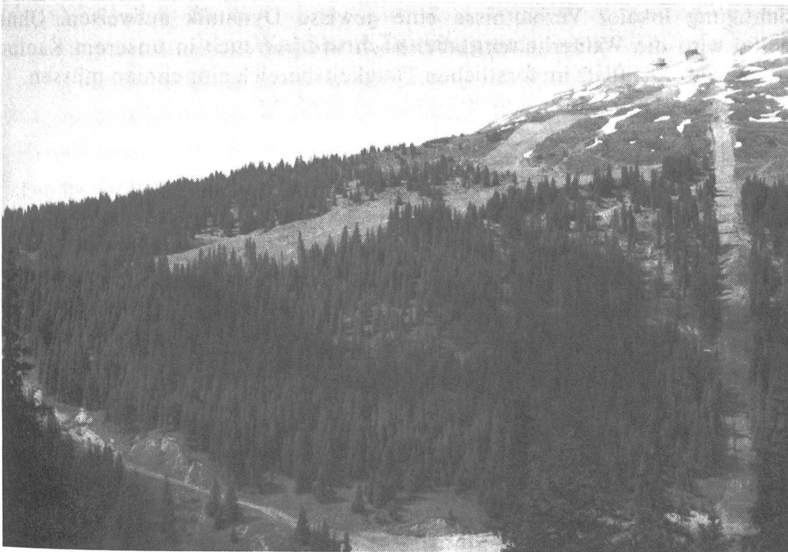
Abbildung 2. Den Förstern fällt die mehr oder weniger dankbare Aufgabe zu, den Wald vor dem immer grösser werdenden Rodungsdruck zu bewahren und wo Rodungen bewilligt werden, für geordnete Ausführung und Ersatzaufforstung besorgt zu sein.

Ersatzaufforstungsfonds kommt nur in Ausnahmefällen in Betracht, da mit dieser Massnahme der gesetzlich geforderten Beibehaltung einer regionalen Walderhaltung nicht genügend Nachachtung verschafft werden kann (Abbildung 2).