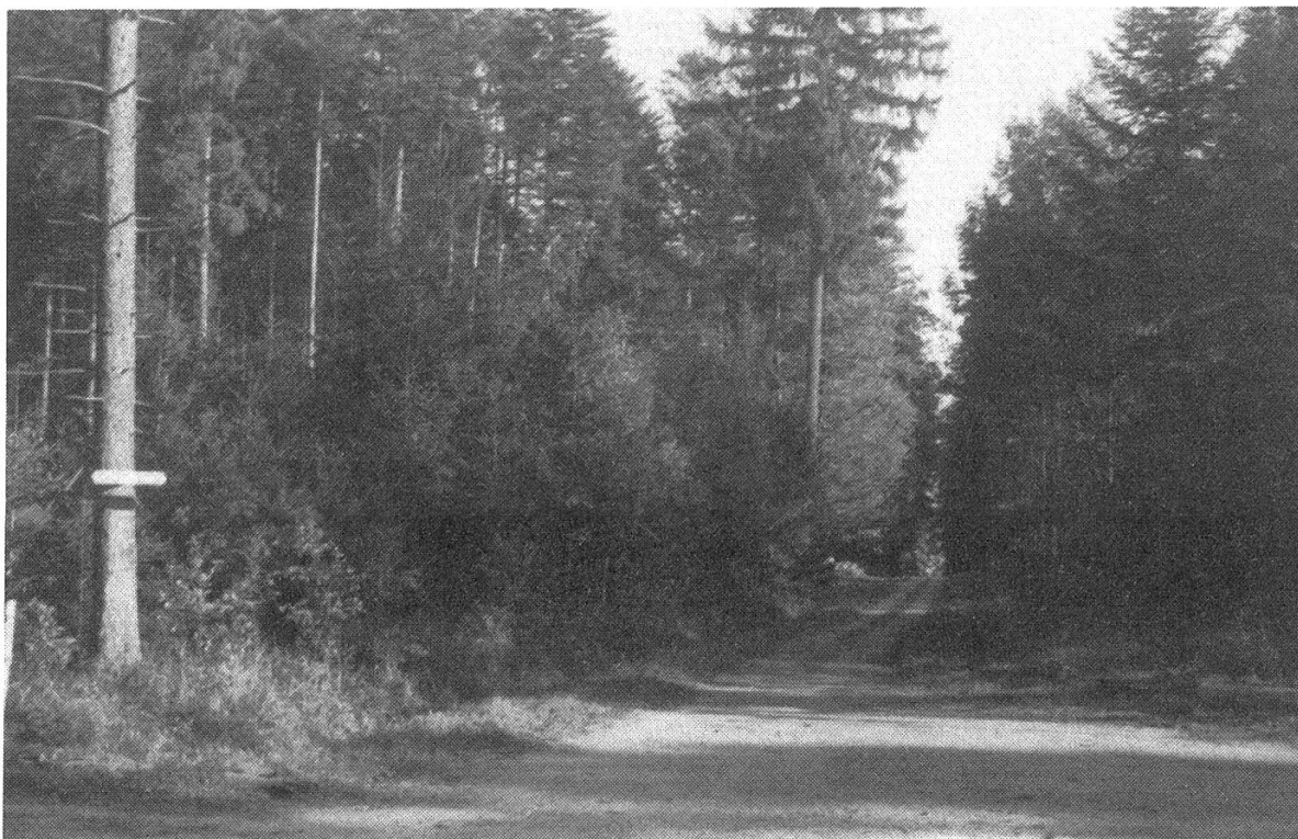
Figure 1. Cône de rajeunissement naturel, dans lequel le sapin blanc prend trop d'importance. Les soins culturaux devront favoriser les feuillus, dont on voit quelques exemplaires sous le signal du tourisme pédestre.

conservons ceux qui existent encore (chêne d'Amérique, Sitka, sapinette du Canada, sapin de Vancouver, cèdre de l'Atlas, Libocèdre décurrent, etc.). (Figures 1 et 2).