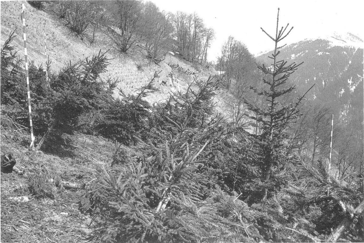
Abbildung 2. Beispiel einer Testfläche mit verschiedenen Schadentypen und einem vorwachsenden Baum von rund 3,8 m Höhe, der den Schneekräften bereits genügend Widerstand entgegensetzen kann.

Bei einer Expositionsänderung von Südosten nach Süden besteht eine abnehmende Tendenz des Schädigungsgrades.