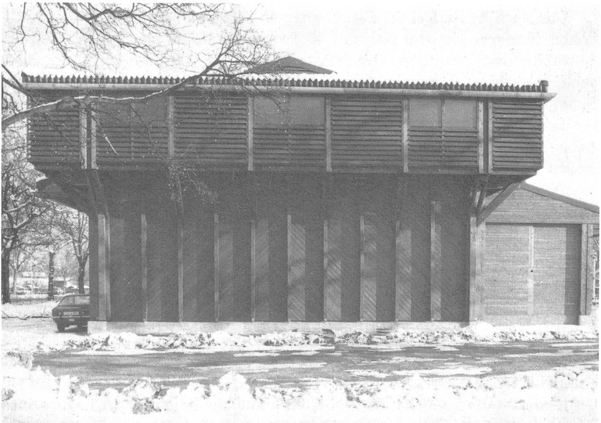
Abbildung 6. Überzeugende Resultate aus dem Lignum-Holzbaupreis 1984/85: Die neue, zur Aufbewahrung von Futtermitteln bestimmte Bergescheune des städtischen Gutbetriebs Juchhof (Architekt Willi E. Christen) zeigt exemplarisch, wie auch grosse Zweckbauten aus Holz in zeitgemässer Weise zu erstellen sind.

Die Liste der Aktivitäten wäre unvollständig, ohne die Arbeit der regionalen Arbeitsgemeinschaften zu erwähnen. Diese von der Lignum rechtlich unabhängigen Gruppierungen leisten in den Regionen mit Tagungen, Pressearbeit und Ausstellungen ein ganz erhebliches Arbeitsvolumen. In besonderem Masse setzen sich die regionalen Arbeitsgemeinschaften mit Interventionen zugunsten der Holzverwendung, vor allem in Grossbauten, ein. In diesem Bereich ergän-