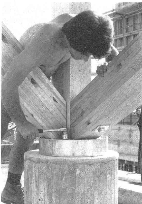
Abbildung 1. Die Lignum wirbt mit Informationen für das Holz — für eine Branche von über 80 000 Arbeitnehmern in rund 12 000 holzverarbeitenden Betrieben.

Eine der Hauptlasten zur Förderung der Holzverwendung trägt seit über 50 Jahren die Schweizerische Arbeitsgemeinschaft für das Holz, Lignum. 1931, in einer Zeit weltweiter wirtschaftlicher Depression war ihre Gründung eine weit-sichtige und bedeutungsvolle Tat. Die gemeinsamen Interessen und der feste Wille zur Selbsthilfe liessen aus einfachen Anfängen eine starke Institution entstehen, welche für andere Baustoff-Gruppen wegweisende Arbeit leistete ( Abbildung 1 ).