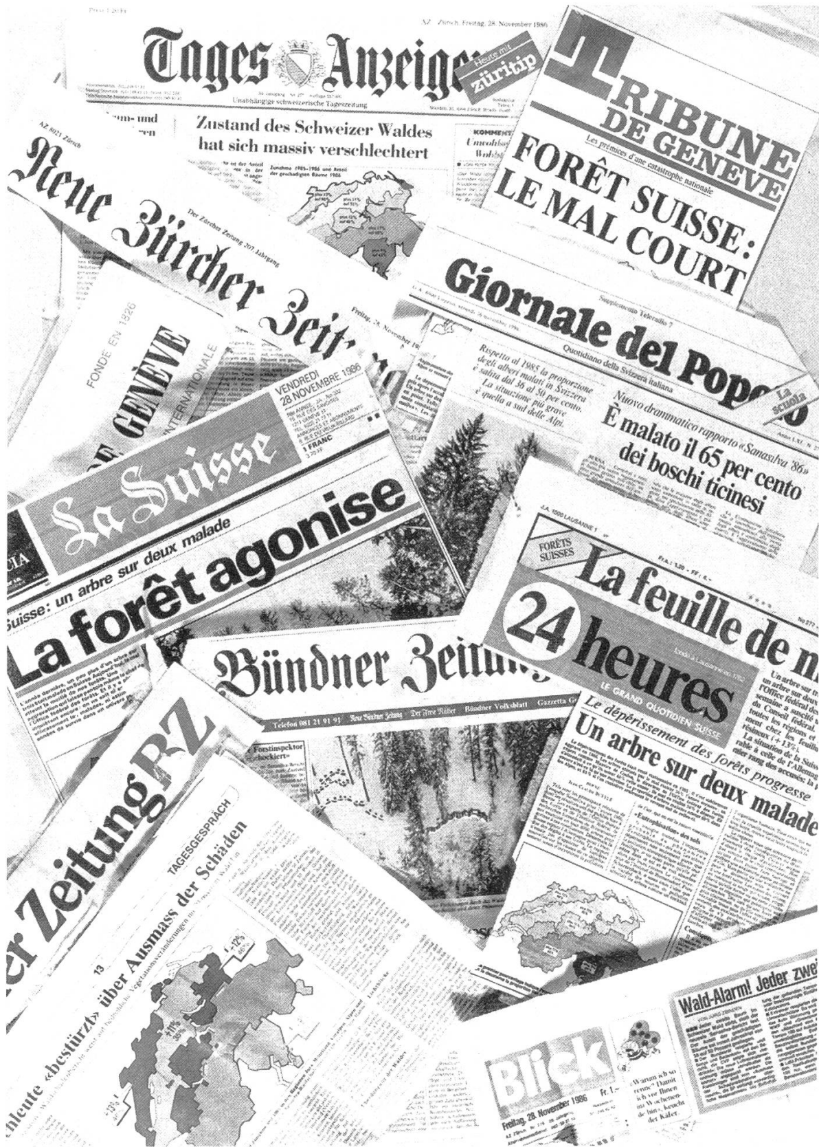
Abbildung 3. Titelseiten einen Tag nach der Veröffentlichung des Sanasilva-Waldschadenberichtes 1986.