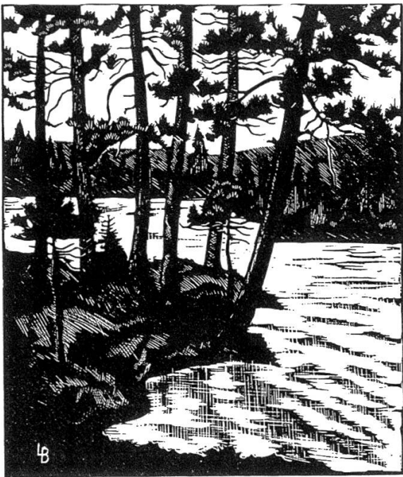
Excursion B. Etang de la Gruère.