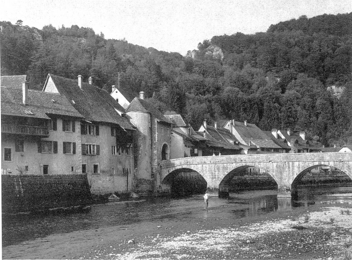
Excursion E. St. Ursanne.