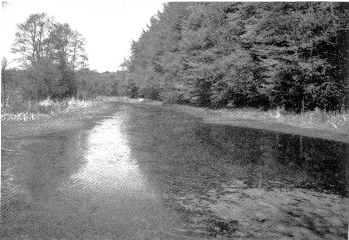
Excursion G. Etangs de Bonfol.