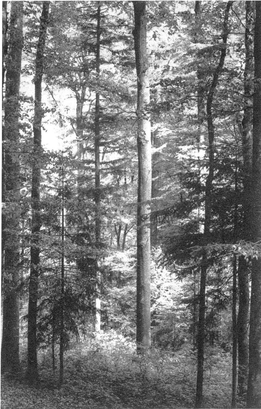
Abbildung 3. Bauern-Buchenplenterwald mit Dauerproduktion von hochqualifiziertem Buchenutzholz, etwa 400 m ü. M., am Fusse des Böhmerwaldes, Aigen, Österreich. Foto: W. Trepp.

les forêts de la Honegg, c'est donc qu'il s'agit d'une question de principe qui intéresse la sylviculture en général.»