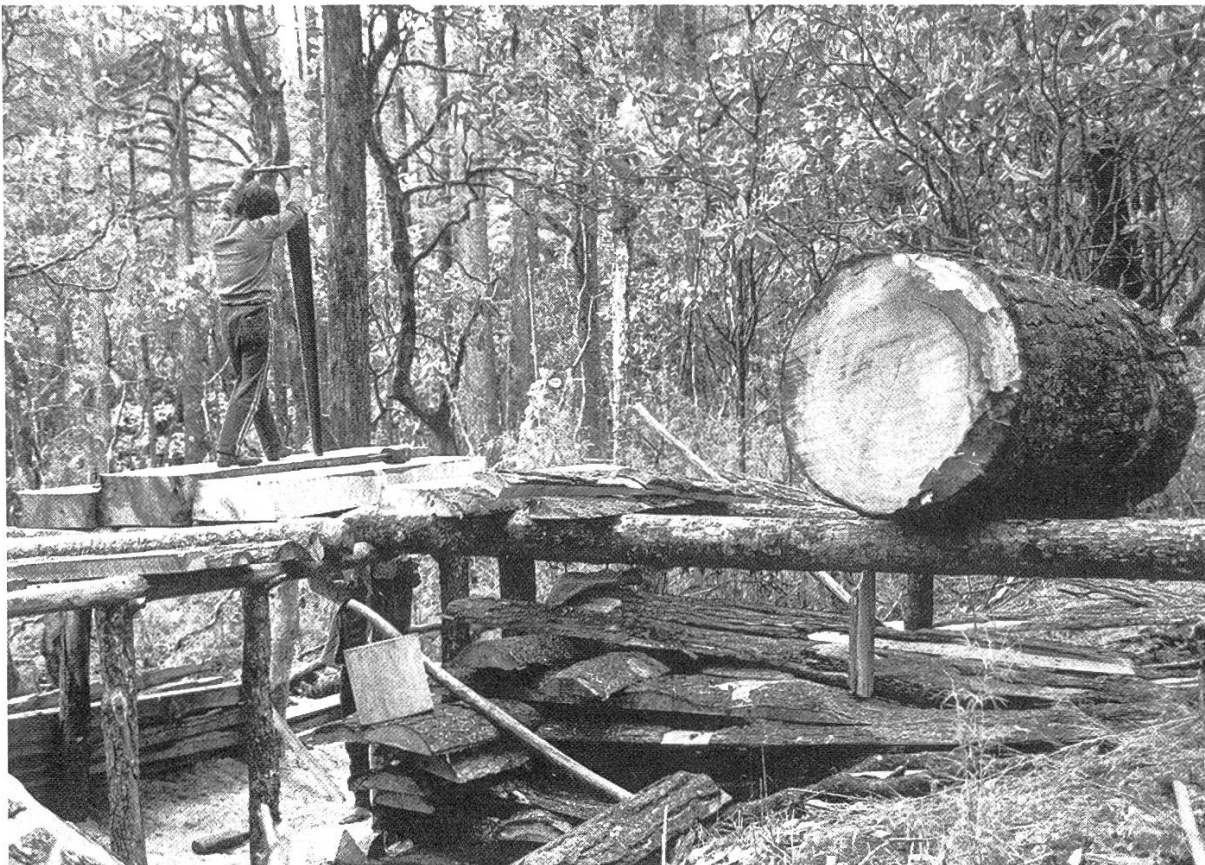
Abbildung 3. Ein Teil des Rundholzes wird noch im Bestand von Handsägern zu Kantholz weiterverarbeitet.