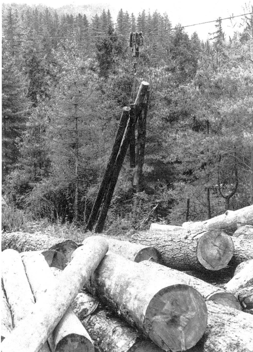
Abbildung 2. Seilkraneeinsatz in den Forstrevieren. Baumart: Blue pine ( Pinus wallichiana ).

tern erschwert. Die Privatisierung von Seilkrananlagen, die vermutlich zu rationellerem Einsatz führen würde (reduzierte Standzeiten), konnte infolge grundsätzlicher Bedenken des Forstdepartementes bis jetzt nicht realisiert werden.