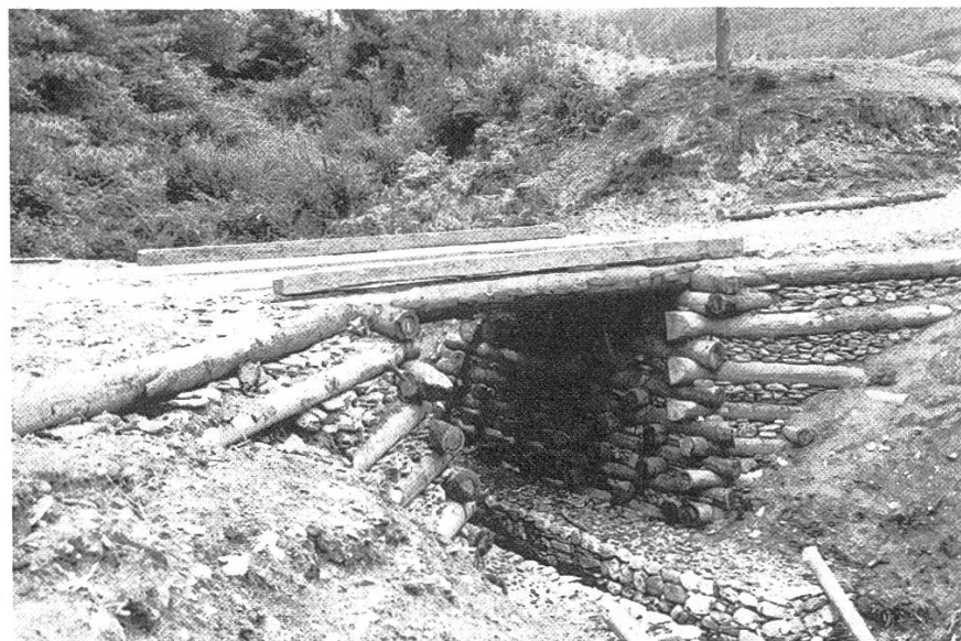
Abbildung 4. Brückenbau mit lokal vorhandenen Materialien.

Das grösste Problem ist die Beschaffung der pro Jahr benötigten 8000 m 3 Trag- und Deckschichtmaterial. Das ursprüngliche Konzept eines permanenten Steinbruches liess sich nicht realisieren, so dass vorwiegend Flussgeschiebe aufbereitet (gebrochen) werden muss, was jedoch während der Regenzeit (Juni bis Oktober) nicht möglich ist.