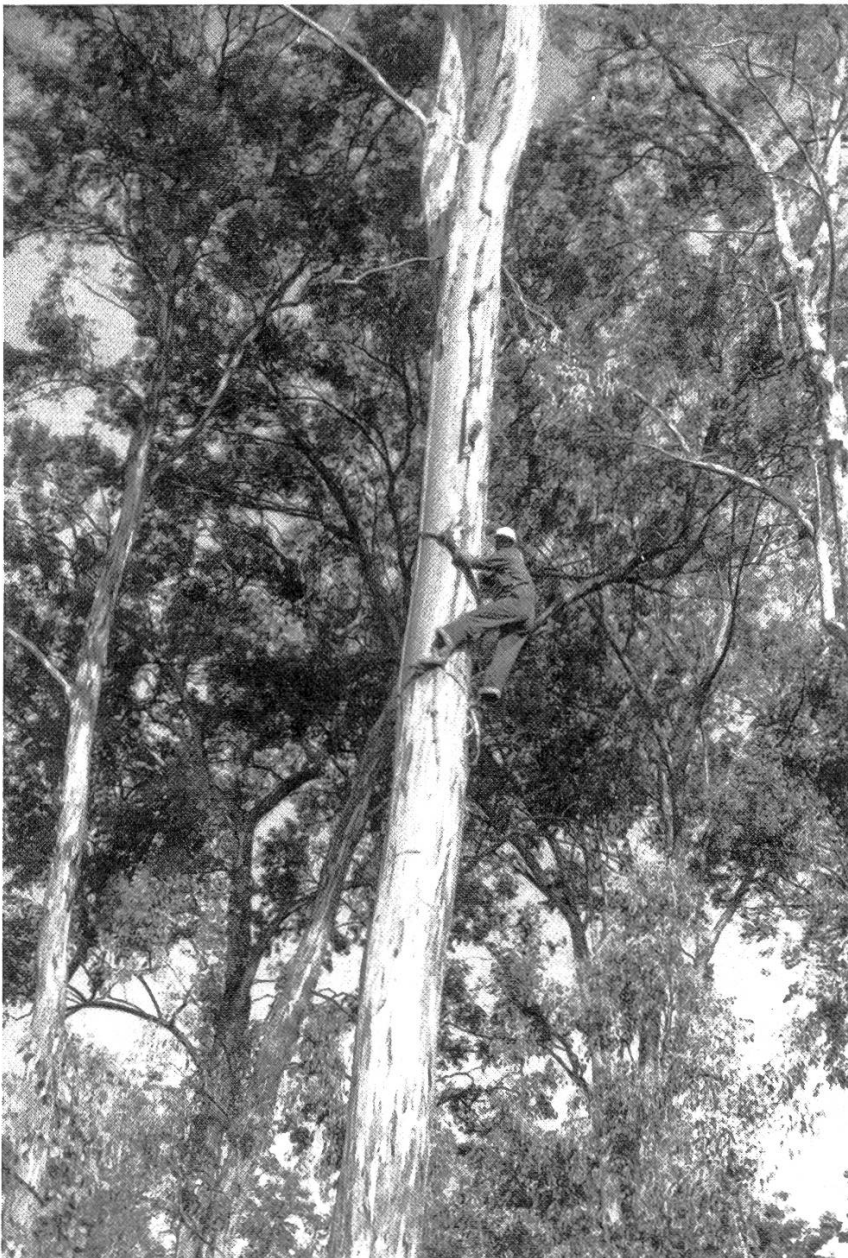
Figure 1. Récolte de graines forestières à l'arboretum de Ruhande, Butare (Rwanda).

massive d'espèces telles que Grevillea robusta , Leucaena leucocephala , Cedrela serrata et Maesopsis eminii . A la fin de la saison de production en pépinière, l'excédent est conservé pour la prochaine campagne de distribution.