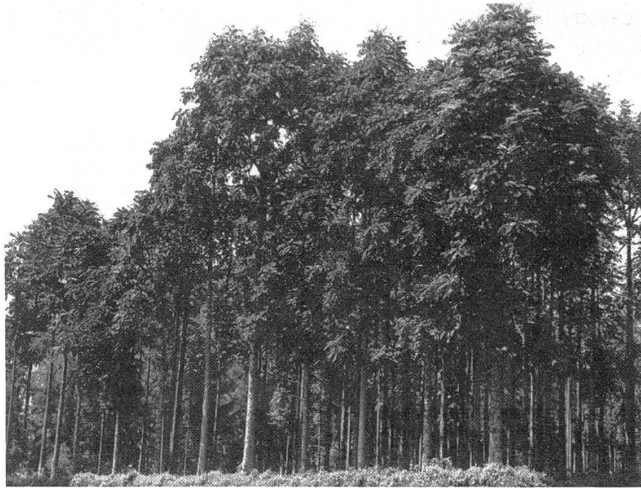
Figure 5. Peuplement semencier de l'espèce locale Entandrophragma excelsum ; parcelle de l'arboretum de Ruhande, Butare (Rwanda).

supérieurs aux pieds mères. Un tel réseau donne d'autre part une garantie d'approvisionnement, indépendamment des aléas du commerce des graines forestières.