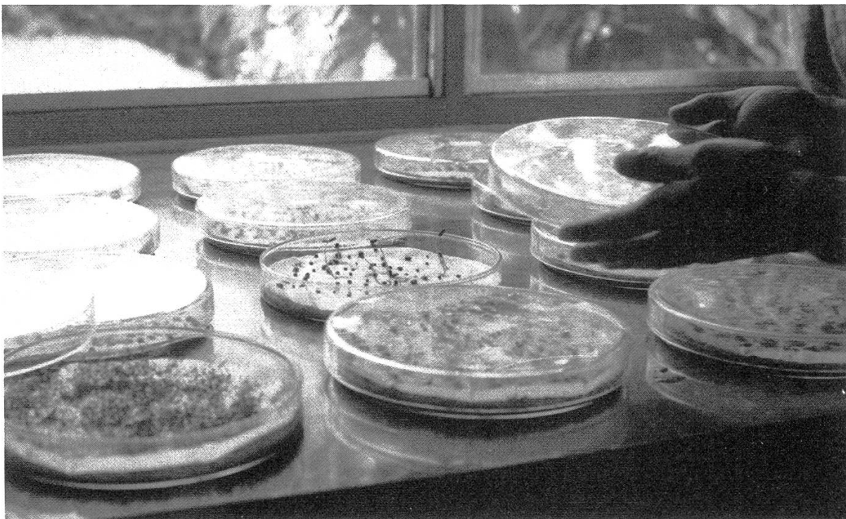
Figure 3. Test germinatif en laboratoire.