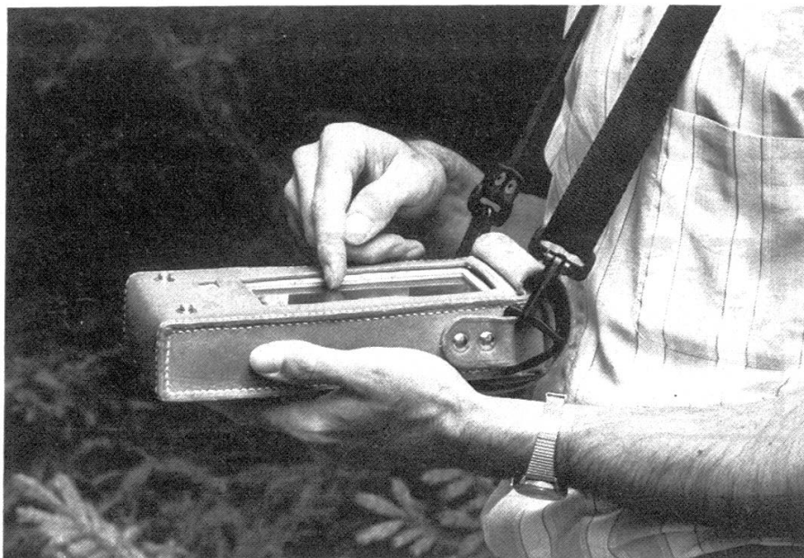
Abbildung 1. Arbeit mit dem Datenerfassungsgerät Epson-Handy Terminal (EHT-10) im Wald.

Mit der elektronischen Datenerfassung auf der Probestfläche im Wald werden die erwähnten Fehler weitgehend ausgeschlossen.