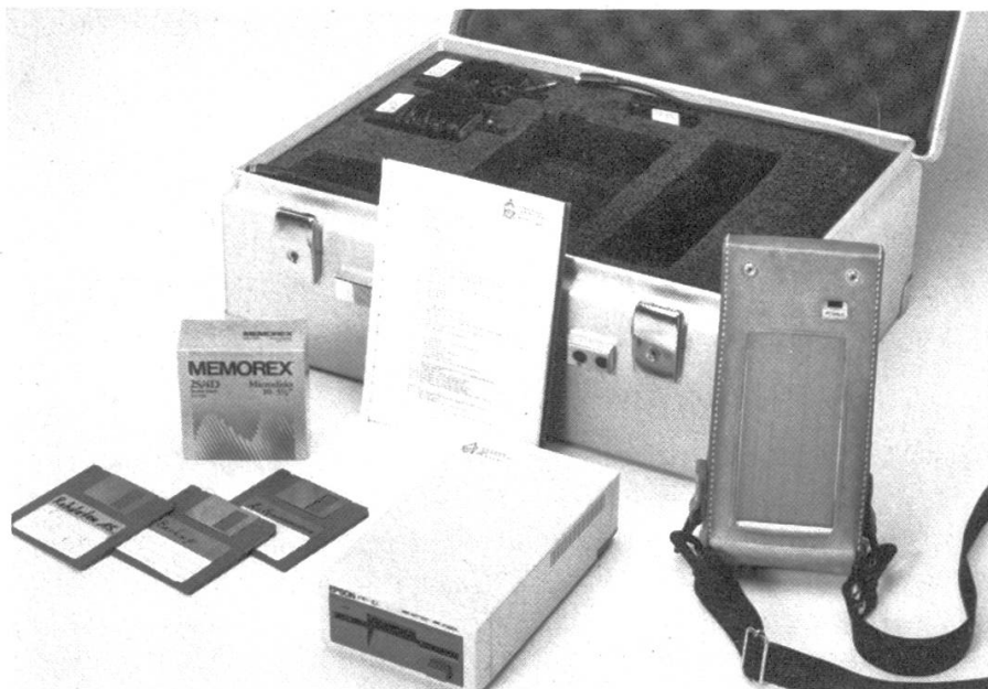
Abbildung 3. Ausrüstung einer Datenerfassungsgruppe: Disketten, Transformer, Diskettenlaufwerk (PF-10), Datenerfassungsgerät (EHT-10) und Gebrauchsanleitung.

Nach erfolgter Arbeit wird die Diskette mit den neuesten Daten zur Zentrale an der WSL gesandt. Dort werden die erfassten Proben auf einem PC von einem Verwaltungsprogramm registriert, noch einmal geprüft und für die laufende Auswertung bereitgestellt.