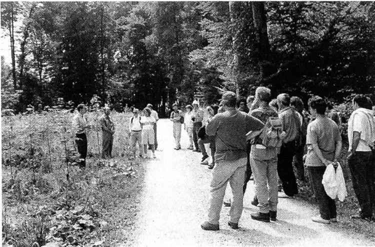
Abbildung 3. Waldführung für den Heimatkundeverein.

Wie schon eingangs erwähnt, gilt es viele Missverständnisse und falsche Vorstellungen zur Waldarbeit auszuräumen. Wir sollten uns dabei nicht «hinter den Bäumen verstecken», denn viele unserer Arbeiten der letzten Jahre können und dürfen sich sehen lassen. Also zeigen und erklären wir sie der Öffentlichkeit anlässlich von Führungen, Rundgängen oder bei anderen sich bietenden Gelegenheiten ( Abbildung 3 ). Wir müssen diese Möglichkeiten, unseren Beruf ins rechte Licht zu rücken, ausnützen und für den Wald und seine Beschäftigten werben.