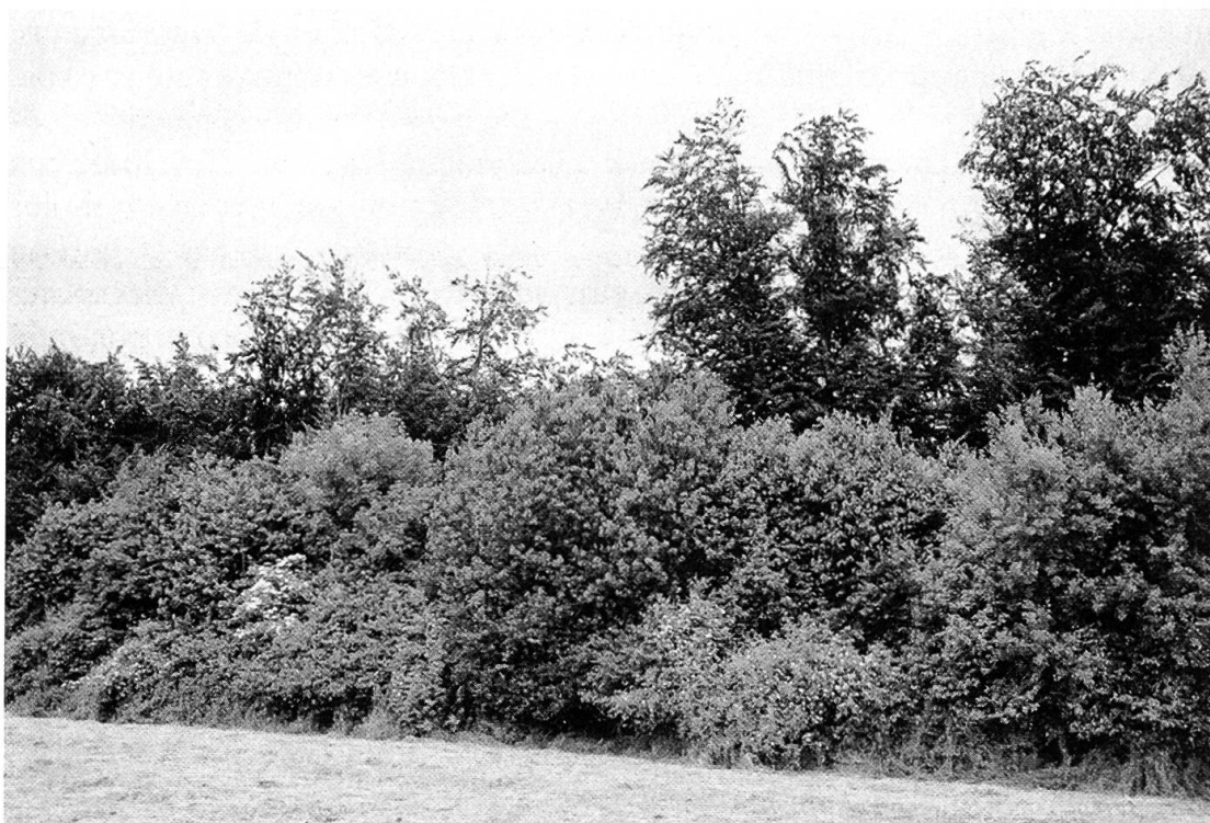
Figure 3. Une lisière en phase optimale, 15 ans environ après une intervention de renouvellement.

arborée de la lisière. Topologiquement on fera la différence entre l'ourlet buissonneux, qui possède un potentiel de développement fulgurant, et la partie en profondeur, qui se comporte de façon assez identique au reste de la forêt et où les règles de sylviculture habituelles peuvent s'appliquer. Des interventions trop brutales au départ dans le cordon buissonneux (sur 5 à 6 m de profondeur), ont pour effet de favoriser un développement unilatéral de buissons, dont la faible diversité ne se corrigera qu'après le temps nécessaire à la succession d'évoluer. Il faut donc éviter de raser de grandes bandes d'arbres et de buissons, mais intervenir en petites surfaces, voire très ponctuellement.