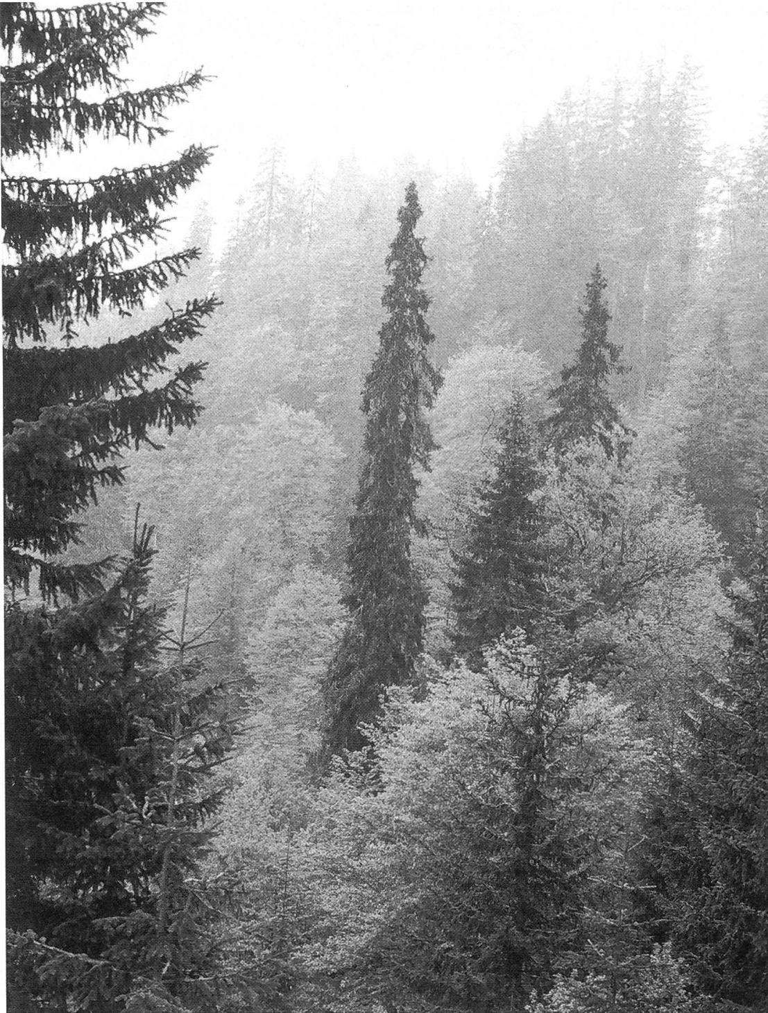
Abbildungen 6 und 7. Fichten-Tannen-Buchenwald im Urwaldgebiet (1600 bis 1950 m ü. M.), bei starker Dominanz der Buche.

Stein (1976) hat auf zwei repräsentativen 300 m langen Probestreifen die Gehölze aufgenommen, Volpers (1985) untersuchte seinerseits je zwei Transekte und zwei Probeflächen im Urwald. Danach erreichen die Buchen im