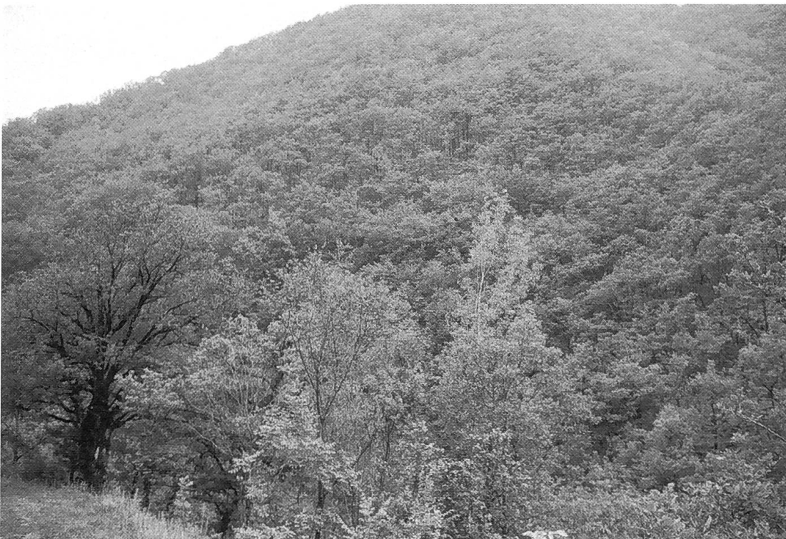
Abbildung 3. Unterhalb 600 m ü. M. gedeihen ausgedehnte Eichenmischwälder.

Eine Stunde Autofahrt von der Zivilisation entfernt, sprudeln in Thermia heisse Quellen aus dem Boden. Dieses Phänomen des Restvulkanismus wird