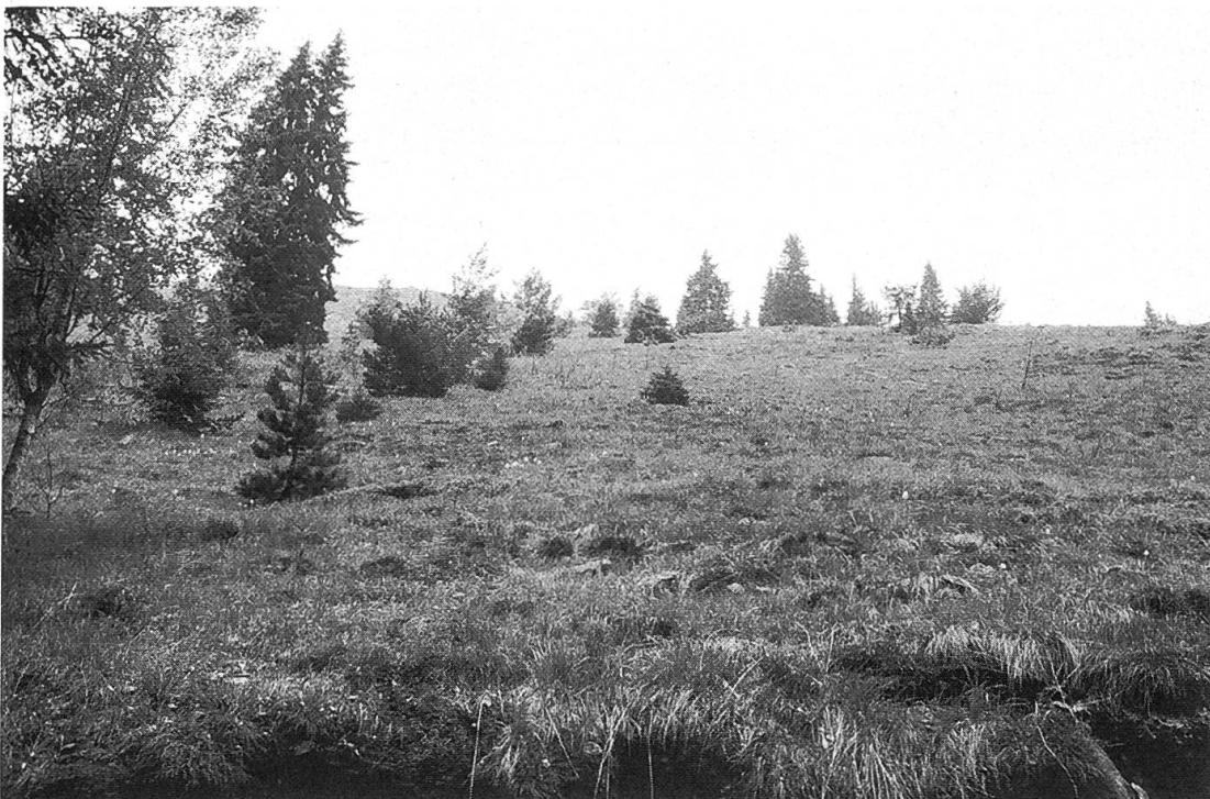
Abbildung 5. Inmitten des Urwaldgebietes finden sich einige hochmontane Matten, die wohl einst durch Brandrodung entstanden sein dürften.

Die optische Ähnlichkeit mit dem mitteleuropäischen Waldaspekt wird in den Hochlagen auch dadurch unterstrichen, dass im Urwald 80% der 52 hier registrierten Bodenpflanzen (ohne Moose und Flechten) sowie 75% der 37 Vogelarten als typische «Mitteleuropäer» zu werten sind ( Stein, 1976 ). Sie lassen dadurch Rückschlüsse auf ehemalige Bestockungsformen in unseren Gebirgen zu. Arealgeographisch handelt es sich für viele Arten wie die Buche und Weisstanne von den subozeanischen und Fichte, Föhre und Birke von den kontinental-borealen Baumarten um die südlichste Arealgrenze. Hierzu gehören auch viele Faunenelemente wie Tannenhäher, Waldschnepfe, Auer- und Haselhuhn.