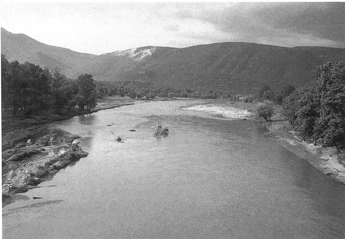
Abbildung 2. Der Wildfluss Nestos bei Stavropouli.