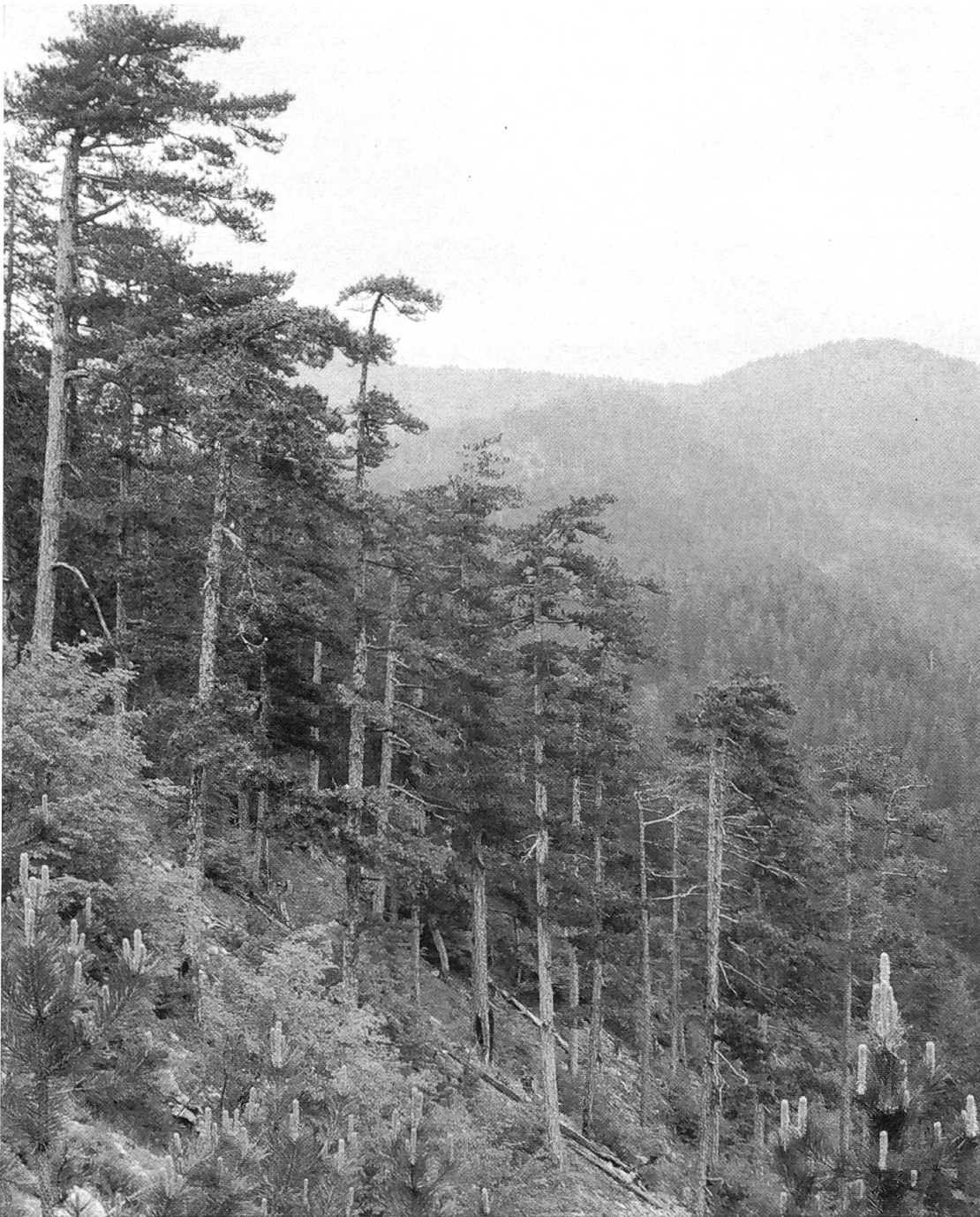
Abbildung 4. Ab 600 m finden sich teilweise geschlossene Föhrenwälder.

Urwald, nach Westen ergibt sich die Möglichkeit, über einen Rundweg durch das Forstrevier Elatia via Skaloti und Sidironero zur Zivilisation zurückzukehren. Ab dieser Weggabelung wechselt auch das Vegetationskleid markant. Je nach Untergrund dominieren nun die Buche oder die Föhre ( Pinus peuce und höher silvestris ) (Abbildung 4).