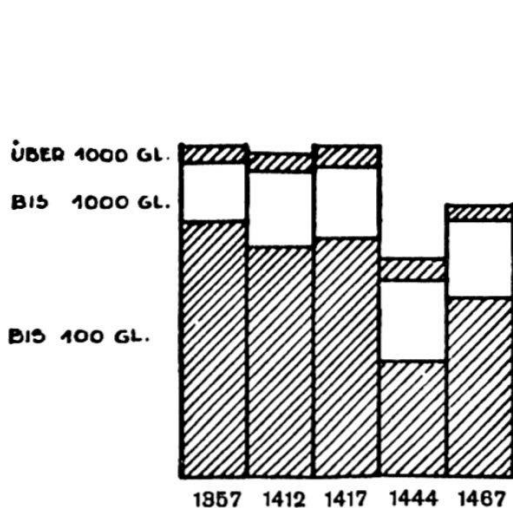
Fig. 1. Die Kopfstärke der sozialen Gruppen

Noch deutlicher wird dieses Bild aus den Vermögenszahlen. Es zeigt sich, daß der Beitrag der untersten Gruppe zum städtischen Gesamtvermögen auch jetzt wie 1444 bedeutungslos ist. Die bescheidene Mittelgruppe steht verhältnismäßig besser da als je und bleibt nur absolut etwas hinter 1444 zurück. Die Vermögenden haben mindestens ein Drittel ihres Vermögens von 1444 verloren und stehen verhältnismäßig schlechter als 1412—1444, aber immer noch ziemlich stärker als 1357 da. Am stärksten sind die Reichen zurückgegangen; sie haben mehr als die Hälfte ihres früheren Reichtums verloren und auch verhältnismäßig stark eingebüßt. Anstatt eines starken Drittels des städtischen Gesamtvermögens haben sie jetzt nur noch weniger als einen Viertel in der Hand. Bezeichnenderweise erreicht das höchste Vermögen jetzt auch nur noch 12 000 Gulden. Der Zürichkrieg hat also alle sozialen Gruppen der Stadt betroffen, besonders stark aber die Reichen, die mehr als den ganzen Gewinn der ersten Hälfte des 15. Jahrhunderts eingebüßt haben. Die Vorstädte spielen nach wie vor keine Rolle und weisen nur einen Steuerzahler mit einem Vermögen von wenig mehr als 1000 Gulden auf.