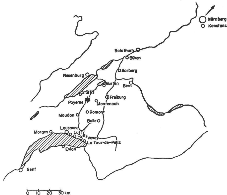
Handel mit Payerne im 15. Jahrhundert

mittelgewerbe die Metzger und Müller, aus dem Bekleidungs- gewerbe die Schneider und Schuster, aus dem Baugewerbe die Zimmerleute und Maurer, dann die Schmiede, die Weber, die Gast- wirte, die Küfer, die Barbieri waren in ansehnlicher Zahl vertreten. Es reichte bei den Schneidern zur Bildung einer Bruderschaft, deren Kerze 1475 erwähnt wird, und ebenso wohl bei den Schmie- den, da 1462 eine confratria Sancti Eligii auftaucht. Die Weber