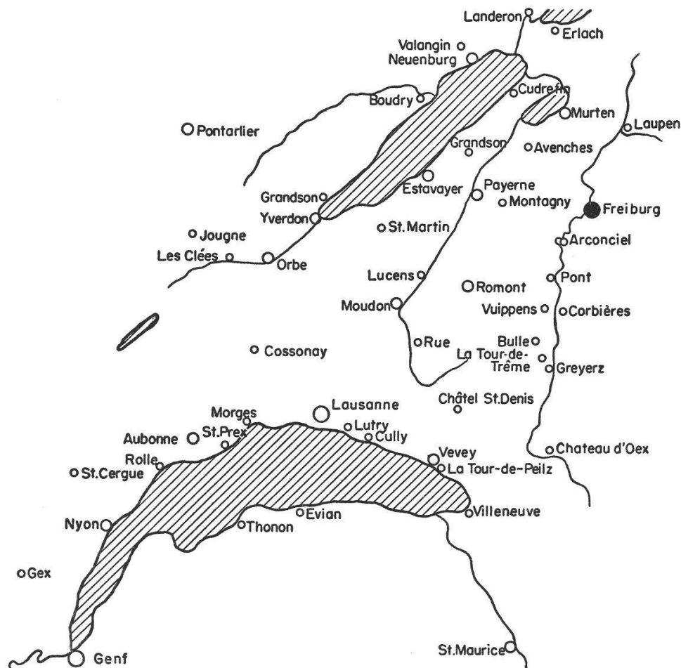
Handel der Westschweiz mit Freiburg i. Ue.

wir das Gewerbe in starker Stellung. So habe ich um 1400 in Lutry Maurer und Zimmerleute, Metzger und Bäcker, Schmiede und Schlosser, Schuster und Kürschner, Schneider und Barbieri gefunden. Daneben wird ein Krämer und ein Tuchkaufmann erwähnt. Regelmäßig erscheinen Leute aus dem ganzen Hinterland bis nach