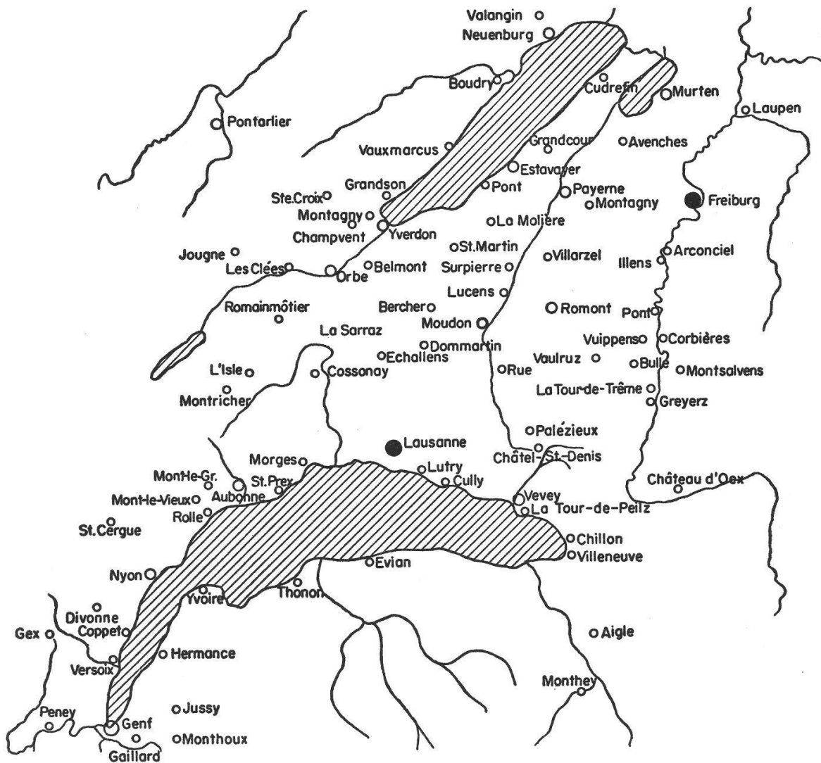
Die mittelalterlichen Städte der Westschweiz

darin, wo der große Verkehr durchlief und Einnahmen flossen, war mit Orbe herausgebrochen; es befand sich in der Hand der Grafen von Burgund. Offenbar als Gegenmaßnahme erbauten zu Anfang des 12. Jahrhunderts die Herren von Grandson das Schloß La Sarraz