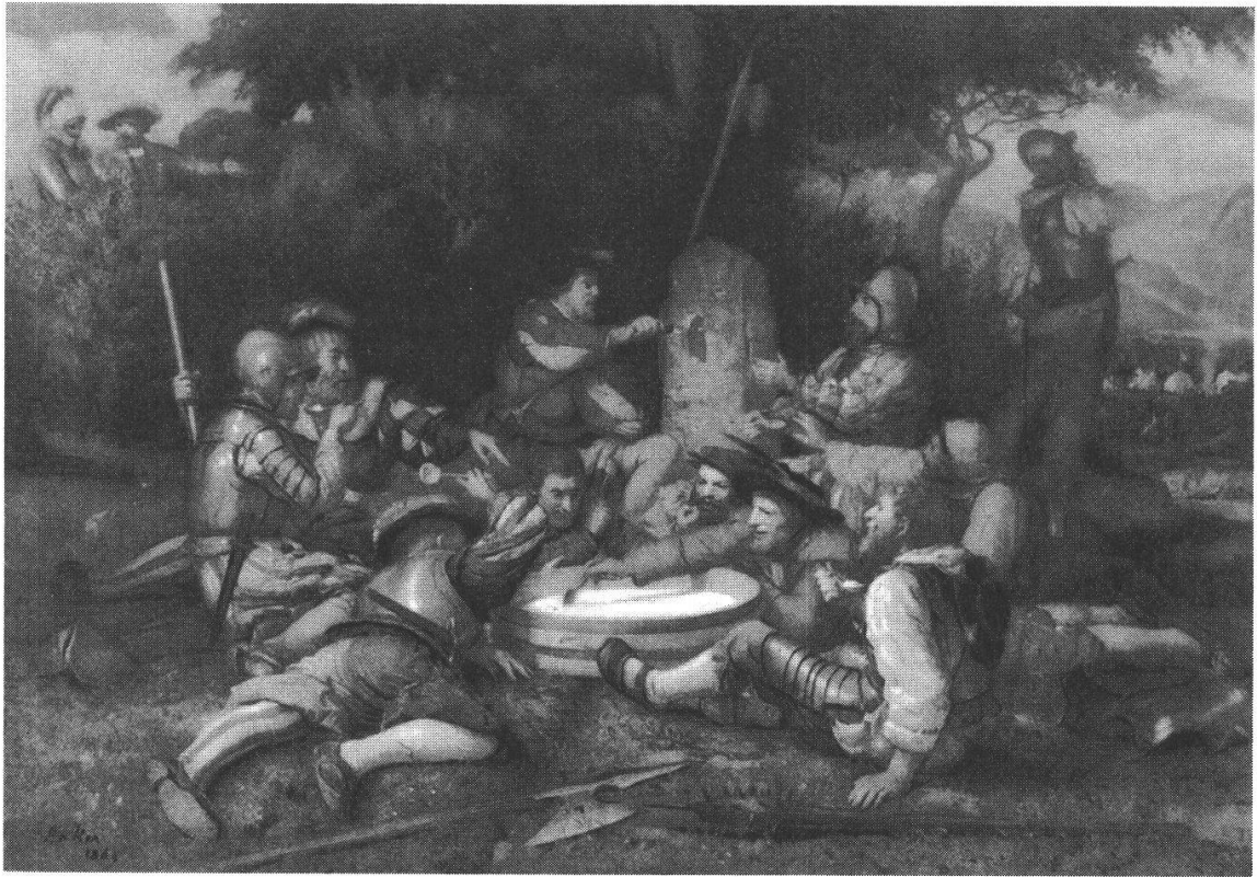
Abb. 4a. Albert Ankers Darstellung um 1869 (in Privatbesitz), hier nach der Vorlage der Bundesfeierkarte von 1952.