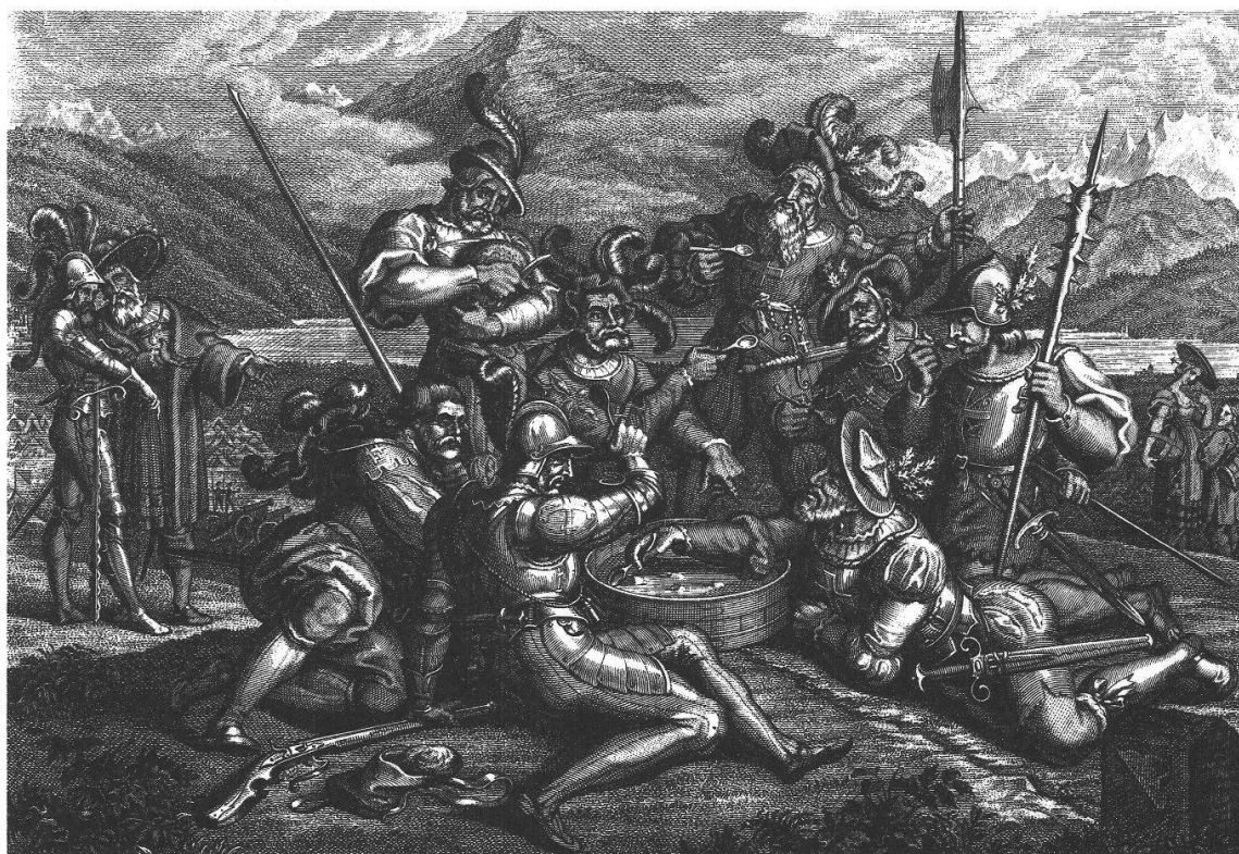
Abb. 3b. Vogels Darstellung in der Bearbeitung von Suter für das Jahrbuch «Alpenrosen» auf das Jahr 1836 (vgl. Anm. 34).