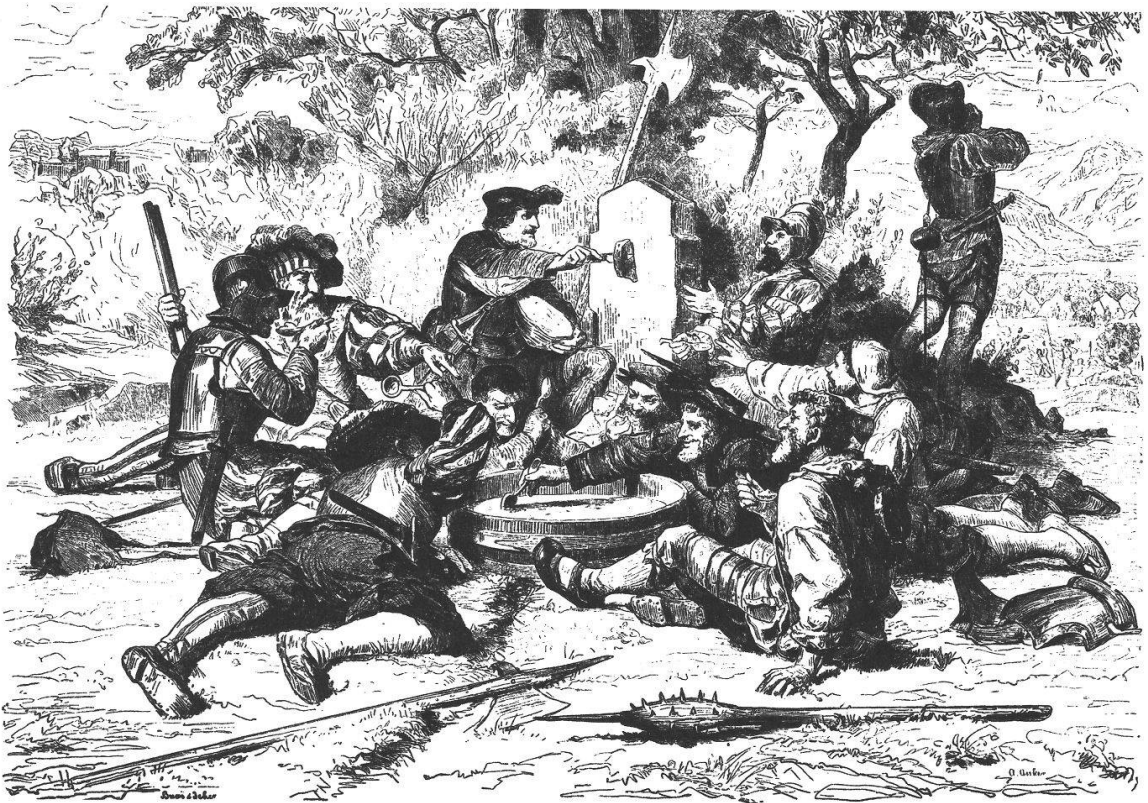
Abb. 4b. Ankers Darstellung in der Bearbeitung von Buri und Jeker, erstmals 1872 veröffentlicht (vgl. Anm. 38).