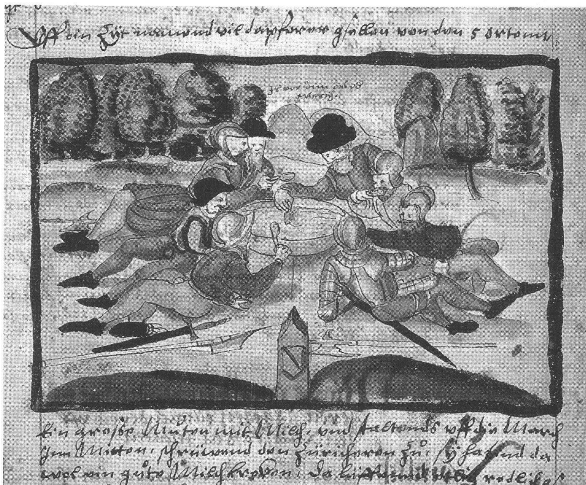
Abb. 1. Aus der 1605 von Heinrich Thommann angefertigten Abschrift der unpublizierten Reformationsgeschichte von Heinrich Bullinger (Zentralbibliothek Zürich).

eigentlich eine Parabel mit einem Handlungsablauf ist, zu einer statischen Metapher, einem einzigen Bild, komprimiert wird. Es erstaunt nicht, dass es neben der literarischen Tradition schon sehr früh auch eine Bildtradition gibt. Bereits Stumpf hat in seinem Manuskript von 1536 einen Leer- raum für eine Illustration ausgespart 31 . Hier ist nun der Ort, die Ebene des bloss imaginierten Bildes zu verlassen und sich dem visualisierten Bild zuzuwenden. Die verbale Schilderung der angeblichen Begebenheit ging der visualisierten Version voraus, nachher trat sie aber in den Hintergrund und wurde vom grossen Publikum als solche kaum mehr rezipiert.