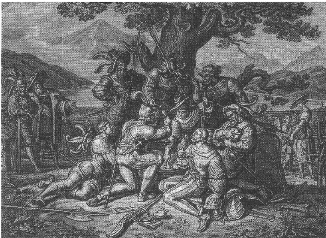
Abb. 3a. Ludwig Vogels Darstellung vor 1836 (Kupferstichkabinett Basel, Inv. Z 170).