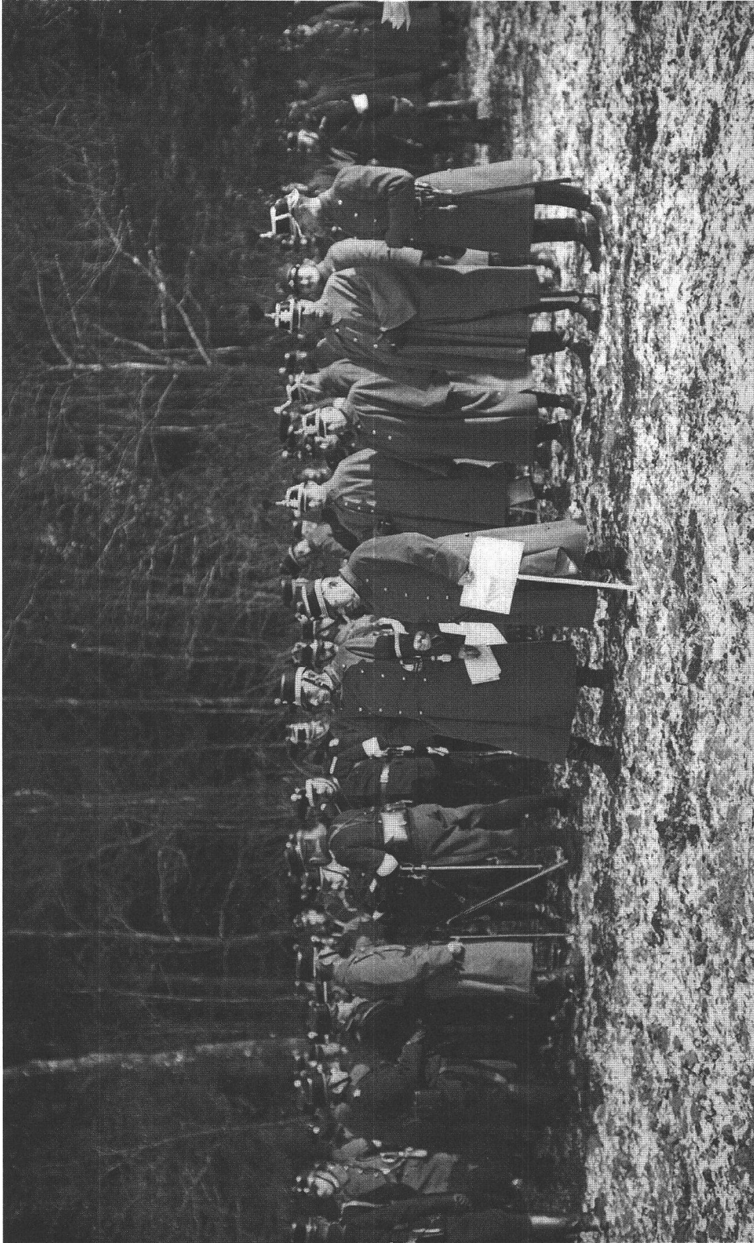
Abbildung 2. Sprecher (li.) und Wille während einer Manöverbesprechung (SpA, Maiefeld).