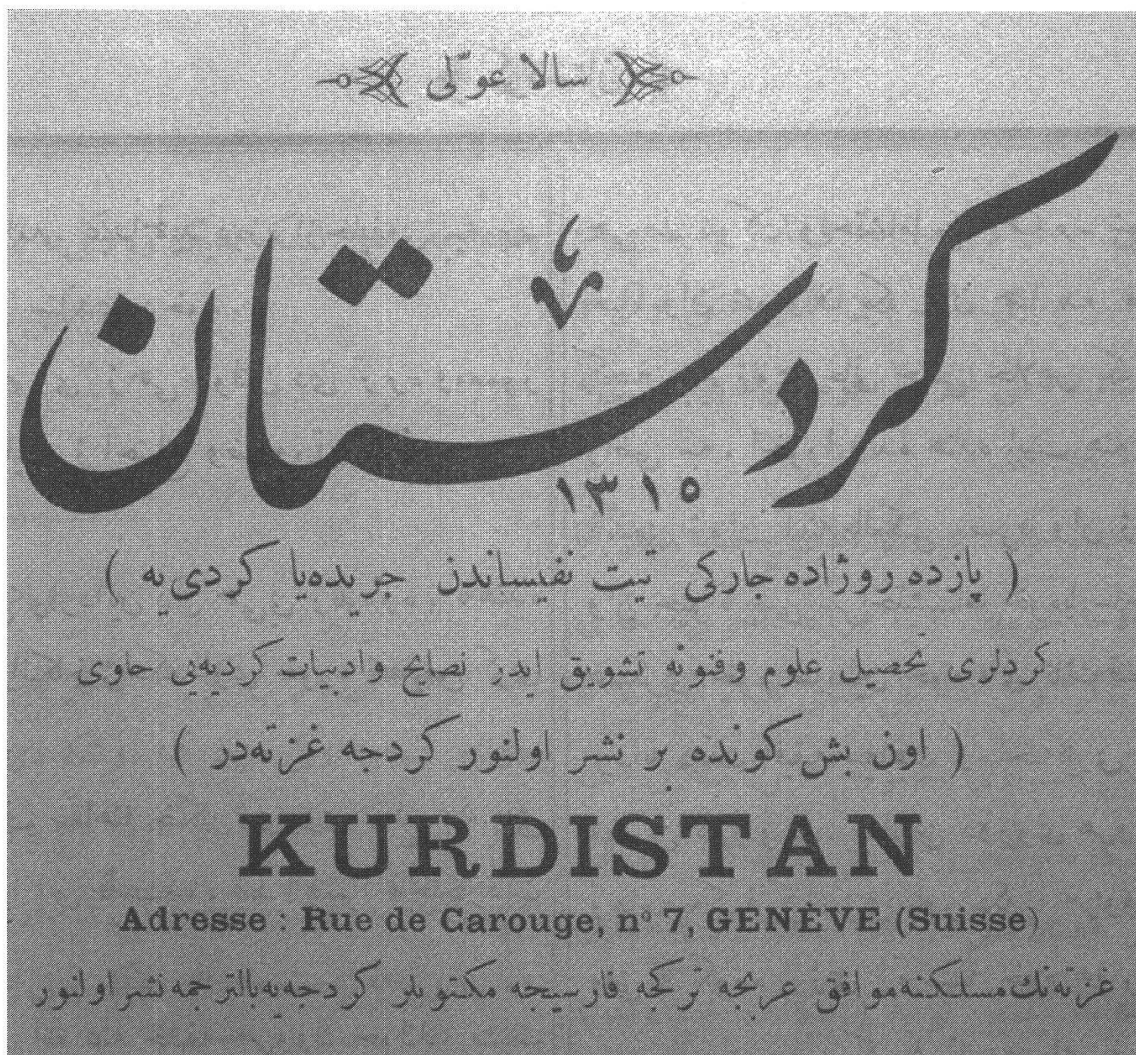
Abbildung 2. Die erste kurdischsprachige Zeitschrift ( Kurdistan ) und ihre Genfer Adresse.

sich nicht mit dem Gewissen des noch jungen Türken, der ich bin. Ich bin von einigen Seiten dazu ermuntert wurden, nach Genf zu gehen, wo man mit drei Liren im Monat leben kann.» 17