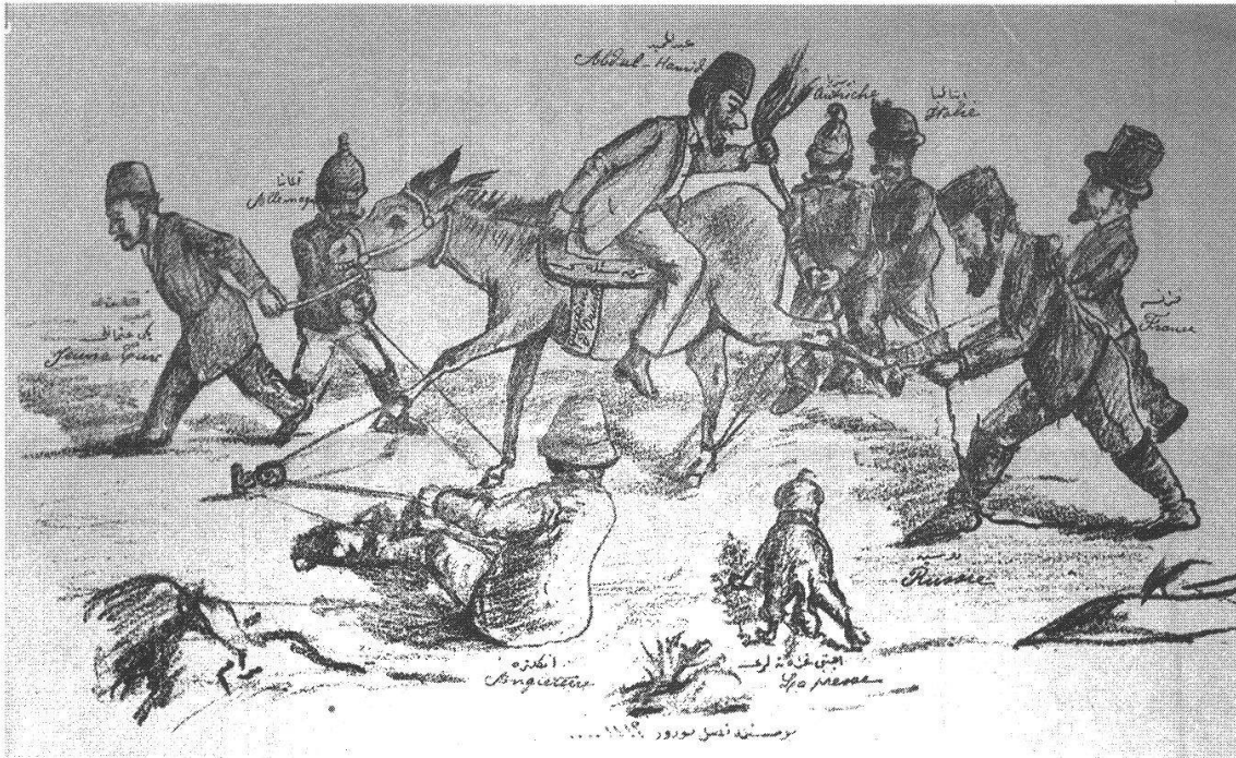
Abbildung 1. Selbstsicht der jungtürkischen Opposition des Fin de Siècle angesichts der aporetischen «Orientalischen Frage»: Der Sultan Abdulhamid rücklings auf einem Esel, während die europäischen Mächte den Esel (Osmanisches Reich) in alle Richtungen zerren und der Hund (Presse) kläfft. Nur die Jungtürken gehen entschlossenen Schrittes vorwärts ( Beberuhi , Nr. 4, Genf, 1898).

Ali Suavi blieb dem ihn faszinierenden Gedanken einer direkten Demokratie treu, verband ihn aber mit dem Postulat einer paternalistischen Sultansherrschaft. An der Schweiz faszinierte ihn das, was er als Puritanismus wahrnahm und für seine Heimat als gesellschaftliches Heilmittel betrachtete 7 . Der in Suavis Text ausgedrückte Respekt für die Institutionen der schweizerischen Demokratie, die Hochschätzung ihrer Bildungseinrichtungen, die Rede von der im Vergleich zum übrigen Europa höheren Moralität (später Argument für den Bildungsaufenthalt von Musliminnen in der Schweiz), und die Bewunderung der Natur sind Konstanten des türkischen Schweizbildes bis weit ins 20. Jahrhundert geblieben 8 .