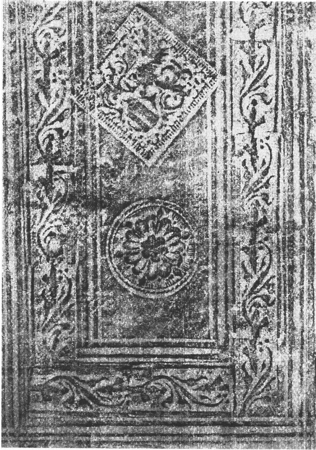
Figure 5. Détail de la reliure (partie inférieure de l'avant plat).

ment, en raison du coût de ce travail. A ce sujet, trois des cinq pièces qui composent le volume de Falck conservé à la Bibliothèque royale de Belgique arborent des ex-libris différents sur leur page de titre, signe d'une période plus ou moins longue sans reliure commune. La reliure de ce recueil est issue de la production de l'atelier des franciscains et est à l'image de celle-ci. Il s'agit d'une demi-reliure en ais de hêtre recouverte de peau de truie, à trois nerfs (235 × 150 mm). Un rectangle allongé encadré d'une bande, une tige et des enroulements de feuillage, délimite le motif décoratif qui se compose de trois roses et de deux losanges aux armes de Peter Falck (fig. 5). Le dos arbore également deux supralibros de Falck accompagnés de deux médaillons avec figure de sainte. Sur les plats, sont présents des entailles pour un fermoir qui ne semble pas avoir été fixé 47 .