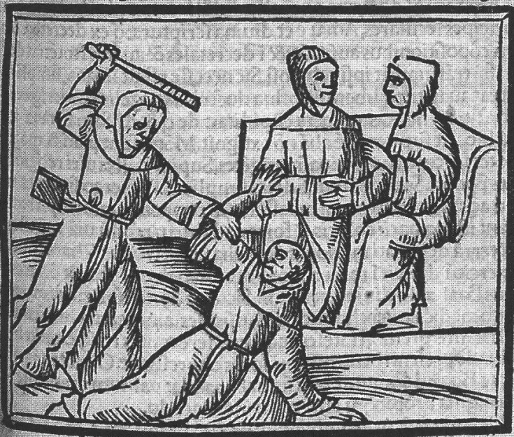
Figure 1. Johannes Lichtenberger, Pronosticatio , folio 17..

Enfin, le livre se clôt avec une œuvre plus légère, la Mensa philosophica , imprimée à Venise par Simon de Luere en 1514 21 . En dépit de