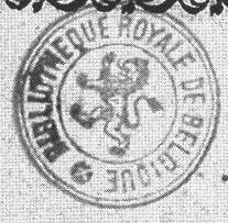
Figure 3. Plutarque, Opuscula , page de titre.